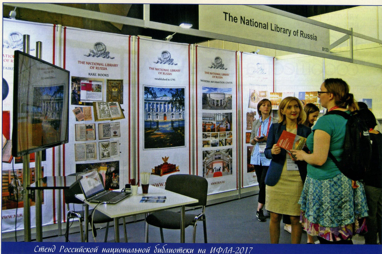
Стенд Российской национальной библиотеки на ИФЛА-2017