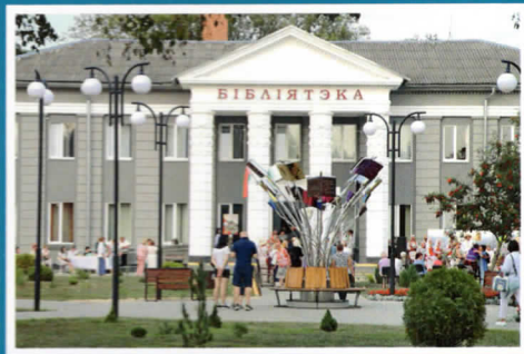
Малая архітэктурная форма «Ляцячыя кнігі» у Ивацевичской ЦРБ.