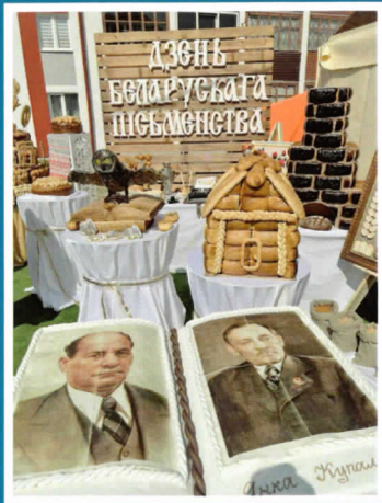
Дзень беларускага пісьменства – 2024.