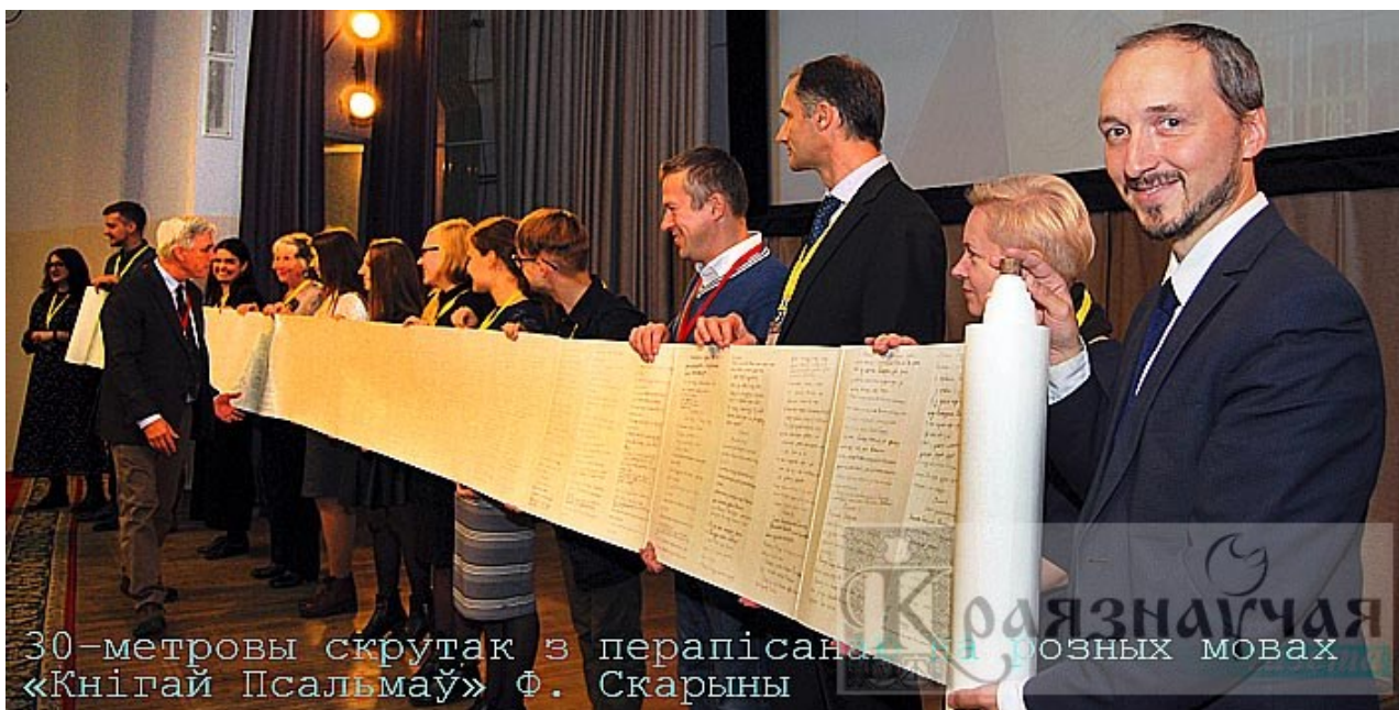
30-метровы скрутак з перапісана ў розных мовах «Кнігай Псальмаў» Ф. Скарыны

Былі абмеркаваныя тэхнічныя пытанні стварэння і ўзаемадзеяння рэгіянальных зводных электронных каталогаў, развіцця карпаратыўных рэсурсаў, стварэння аб'яднанага рэпазіторыя інфармацыйных рэсурсаў адкрытага доступу, праблемы абсталявання і арганізацыі бібліятэчнай прасторы, развіцця тэхналогіяў і сучасных бібліятэчных сэрвісаў, матэрыяльна-тэхнічнага і кадравага забеспячэння. Сучасным падыходам і перспектывам арганізацыі дзейнасці публічных цэнтраў прававой інфармацыі быў прысвечаны круглы стол, на якім заслухана 6 паведамленняў пра арганізацыю прававой асветы ў бібліятэчных установах Наваполацка, Ваўкавыска, Гомеля, Слуцка, Паставаў.