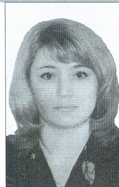
Галоўны бібліёграф Нацыянальнай бібліятэкі Беларусі