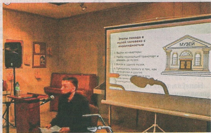
Музей для ўсіх: семінар па пытаннях інклюзіі і безбар'ернага асяроддзя.

Адкрыў для сябе скарбы нацыянальнай літаратуры