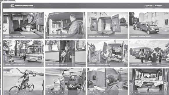
С жизнью «Беларуси библиотечной» знакомит специальный проект, где не только рассказывается о возможностях учреждений, но и представлены занятные факты для любопытных