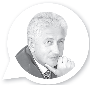
Роман МОТУЛЬСКИЙ, директор Национальной библиотеки Беларуси