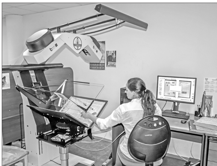
▲ Сегодня в фонде Национальной библиотеки содержится более 500 тысяч электронных документов. Но это лишь начало!

Информационный потенциал страны отражает национальная библиография, составление которой является одной из функций нашей библиотеки. Её НББ выполняет с момента своего основания. Несмотря на то что в 1977 г. Книжная палата вышла из структуры Государственной библиотеки БССР имени В.И. Ленина и трансформировалась в самостоятельное учреждение, тесное сотрудничество с ней не прерывалось никогда. Новые технологические возможности позволили НББ в начале 2010-х гг. приступить к созданию сводного электронного ресурса «Национальная библиография Беларуси» ( http://eir.nlb.by ), цель которого – отразить сведения о документах, важных для страны, начиная с древних времён до настоящего времени. Сейчас в этой БД содержится около 1 млн записей, в том числе более 23,5 тыс. упомянутых экземпляров находятся за пределами республики.