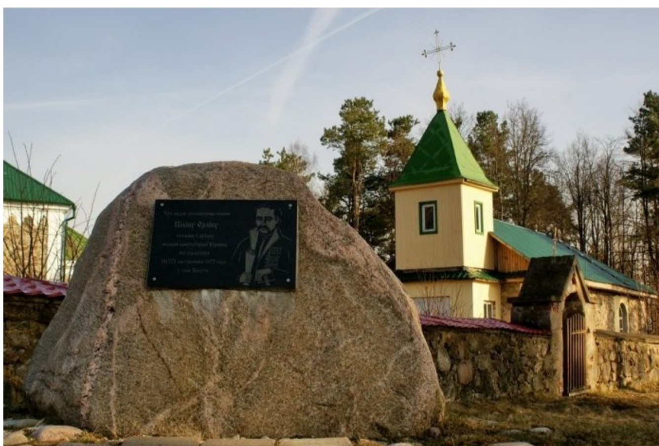
Памятный знак у гонар Піліпа Орліка ў Касуце Фота

25 июня в Национальной библиотеке Беларуси презентовали издание «Конституция Филиппа Орлика», сообщает сайт библиотеки.