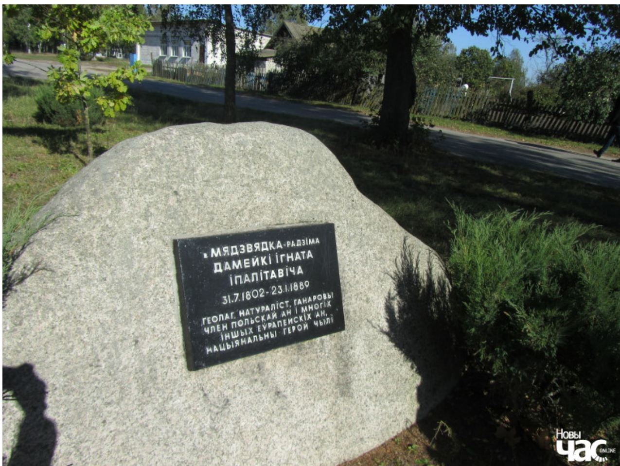
Мемарыяльны камень у в. Малая Мядзядка

Дачушкі сталі дарослымі і незалежнымі, так што Пас спакойна прынялася за жыццёпіс свайго прадзеда — Ігнацыя Дамейкі. Некалькі гадоў яна ішла яго сцежкамі па Літве, Польшчы, Беларусі, Францыі і Чылі — краіне, якая па волі лёсу стала для яго другой радзімай. Усё яе жыццё з таго часу праходзіць пад знакам Ігнацыя Дамейкі. Паўсюль Пас сустракае людзей, якія падпалі пад яго абаянне і бескарысліва дапамагаюць ёй выконваць яе місію. Ці таксама сваю?