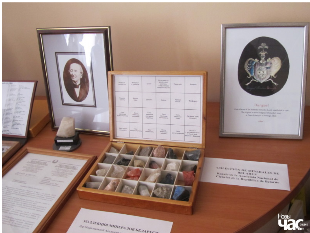
Калекцыя мінералаў Беларусі і Чылі ў школьным музеі г.Мір

Дзякуючы асновам, закладзеным маці і сям'ёй Ігнацыя ў цэлым, Шчучынскай піярскай школай і Віленскім універсітэтам, парыжскія ўніверсітэты ляглі на добрую глебу, і Ігнацы Дамейка заняў годнае месца ў гісторыі навукі і культуры Беларусі, Літвы, Польшчы і Чылі.