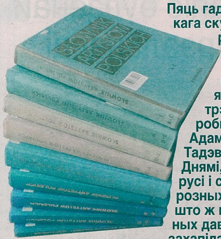
“Slownik Artystow Polskich i obcych w Polsce dzialajacych”