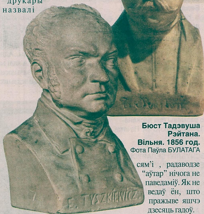
Бюст Тадэвуша Рэйтана. Вільня. 1856 год.