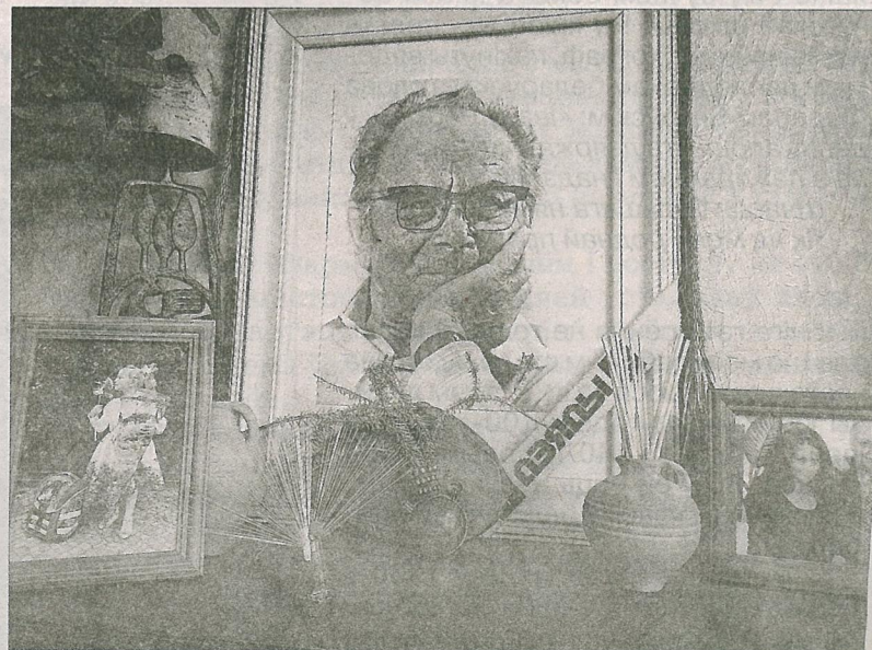
Фотаздымак Яна Скрыгана на кватэры ў Т. Скрыган. 2020 г.