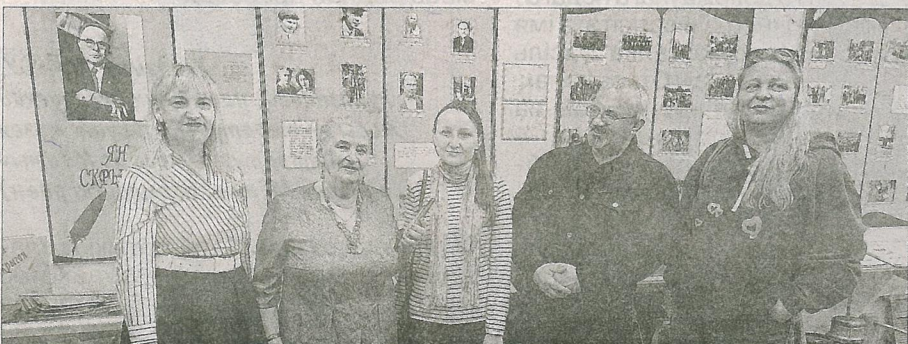
У музеі «Бацькаўшчына». 16 кастрычніка 2022 г.