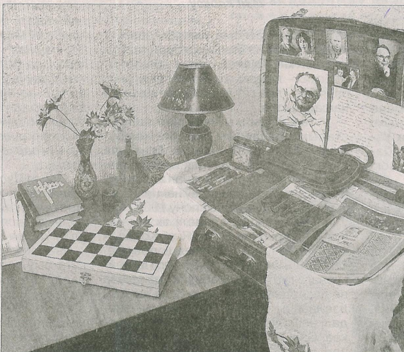
Экспанаты музея. 16 кастрычніка 2022 г.

Знаёмства з Галінай Іванаўнай адкрыла для мяне пісьменніка Яна Скрыгана. На кватэры ў яе – асобныя куточки з фотаздымкамі бацькі, яго асабістымі рэчамі і вырабамі, створанымі яго рукамі. Напрыклад, кіёчкі Яна Скрыгана, якія ён выразаў сам, аздабляючы спецыяльнымі скуранымі завязкамі. З кіёчкамі пісьменнік хадзіў для саліднасці, бо для хады яны яму і не былі патрэбны. Такія ж кіёчкі пабачылі мы на экспазіцыі Яна Скрыгана ў аграгарадку Камень. Галіна Іванаўна перадала для музея шмат асабістых рэчаў бацькі.