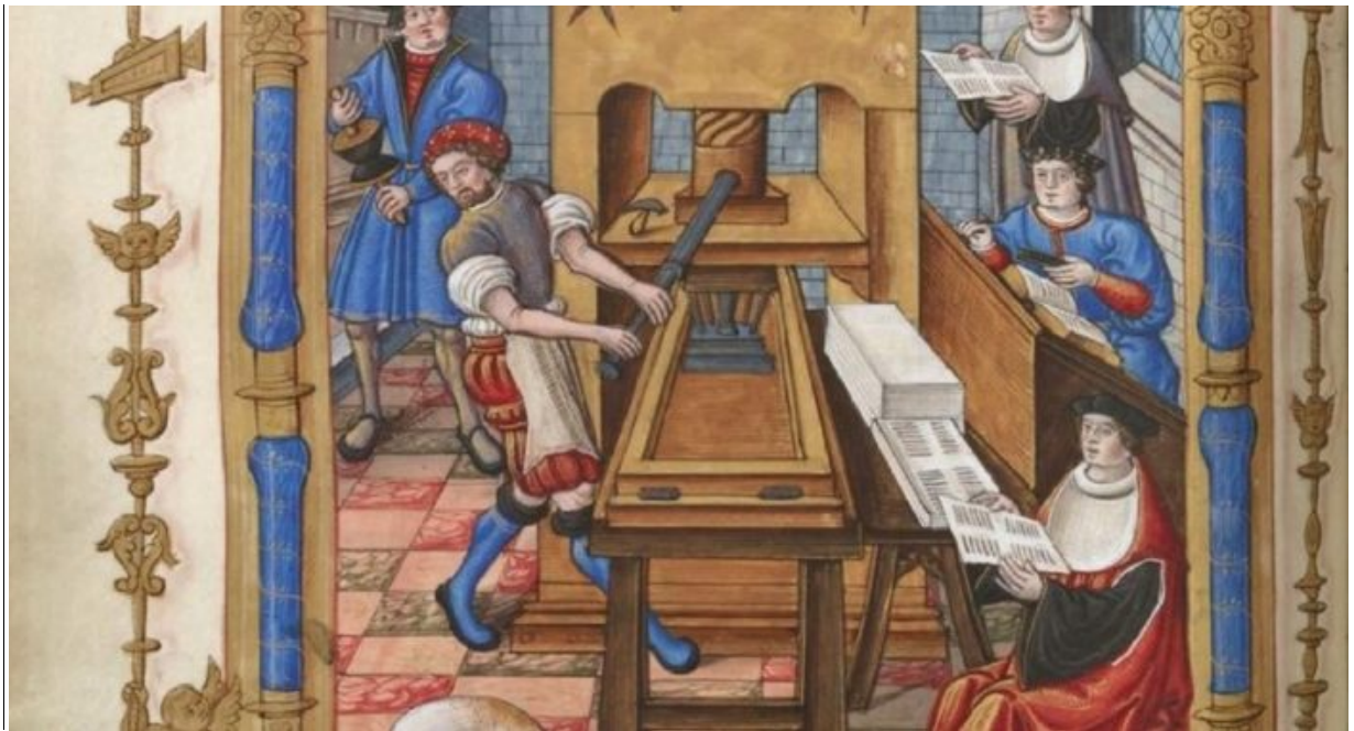
Гравюра XVI века, с изображением процесса изготовления книги

Особенность концепции в том, что она соединяет три грани – историческую, художественную и практическую издательскую в едином эстетическом решении. Подача произведений каждого участника проекта раскрывает как авторское мастерство, так и его уникальную творческую индивидуальность.