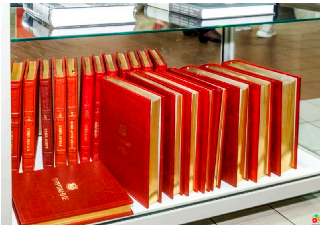
Библия Франциска Скорины. Факсимильное издание

Художественную экспозицию дополняют современные белорусские книжные издания.