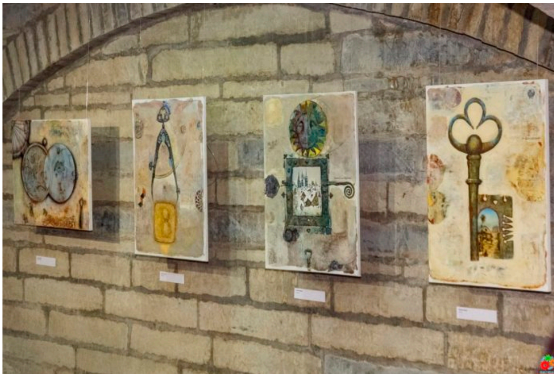
Автор работ — художник Владимир Довгяло

Глубинную связь, соединяющую первое печатное издание Ф.Скорины с современной художественной традицией, богатой аутентичными элементами и мотивами, демонстрирует сакраментальное прочтение скорининской Библии в произведении Валентины Шобы, которое называется «Культурный слой» и выполнено на античных досках в уникальной авторской технике с использованием почвы из разных регионов Беларуси.