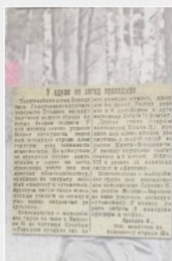
Успехи партизан. Помощь из братских республик. Комсомольцы в авангарде. Новости сферы культуры и искусства

В газете «Калгаснік Копыльшчыны» [№ 22. С. 2] опубликованы рассказы партизан о своих боевых делах. В статье «У адказ на загад правядыра» говорилось об активизации деятельности в ответ на первомайский приказ И.В. Сталина – комсомольскими группами пущены под откос два эшелона, в которых