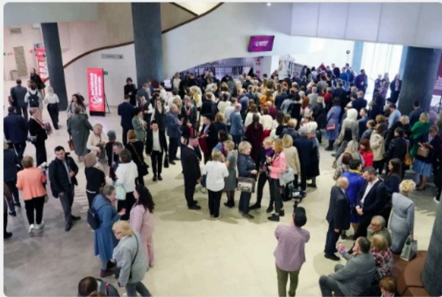
Балтийский культурный форум. 17 апреля 2024 года, Светлогорск

Светлогорск стал площадкой обсуждения актуальных проблем, поиском возможностей, подписания соглашений о сотрудничестве. Например, Калининградская областная научная библиотека подписала соглашение о сотрудничестве с Национальной библиотекой Белоруссии. Правительство Калининградской области подписало соглашение с Национальным центром исторической памяти при президенте России Российской Федерации о совместной работе, в регионе будет создано структурное подразделение центра.