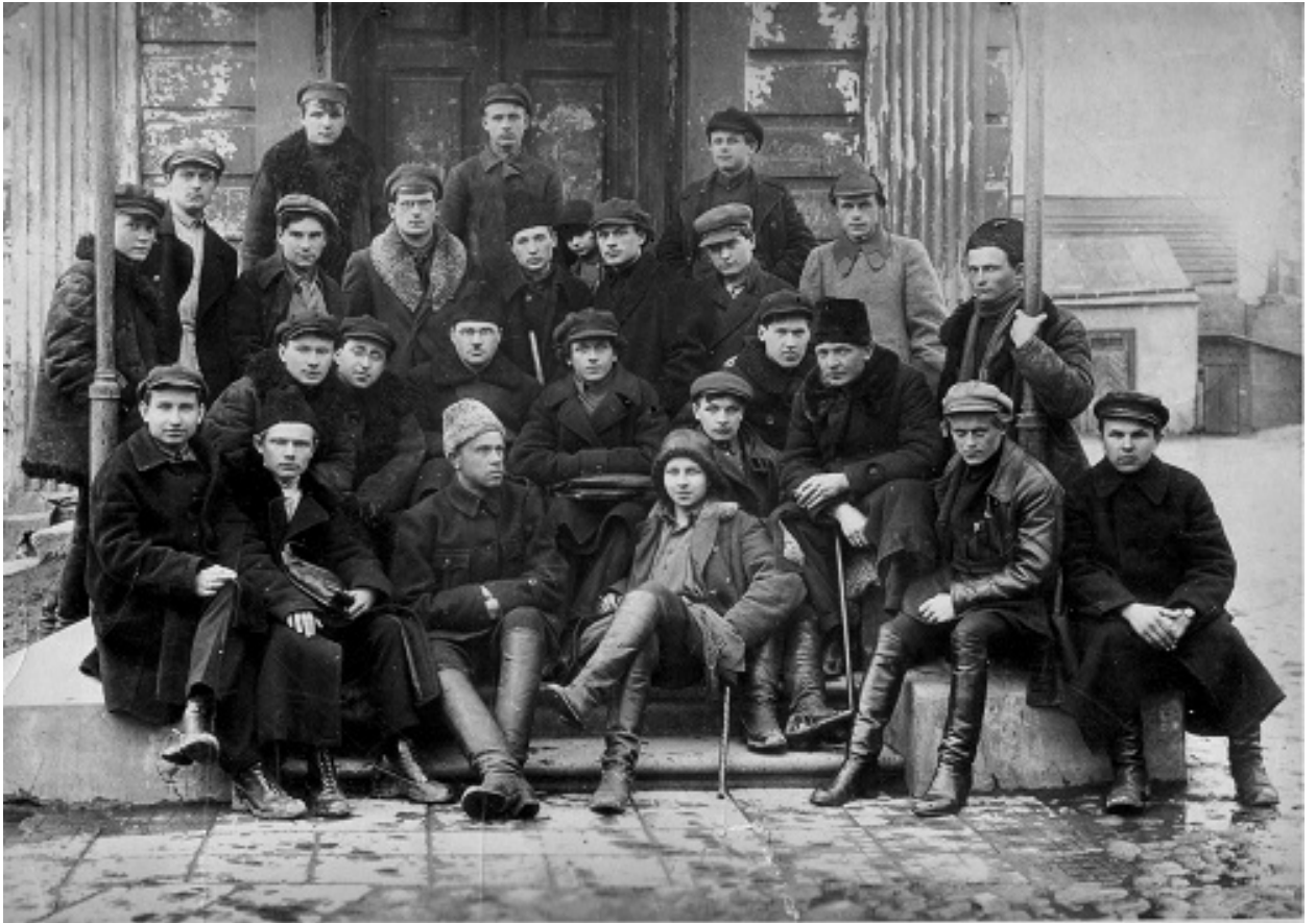
Пленум ЦК «Маладняка». 25 сакавіка 1925 года.

Аб'яднанне паўстала як гурток маладых паэтаў пры часопісе «Маладняк». Датай яго стварэння лічыцца 28 лістапада 1923 года, калі ў мінскім камсамольскім клубе «КІМ» сабраліся шэсць маладых пісьменнікаў: М. Чарот, А. Вольны, А. Дудар, А. Александровіч, А. Бабарэка, Я. Пушча — і вырашылі стварыць літаратурнае аб'яднанне.