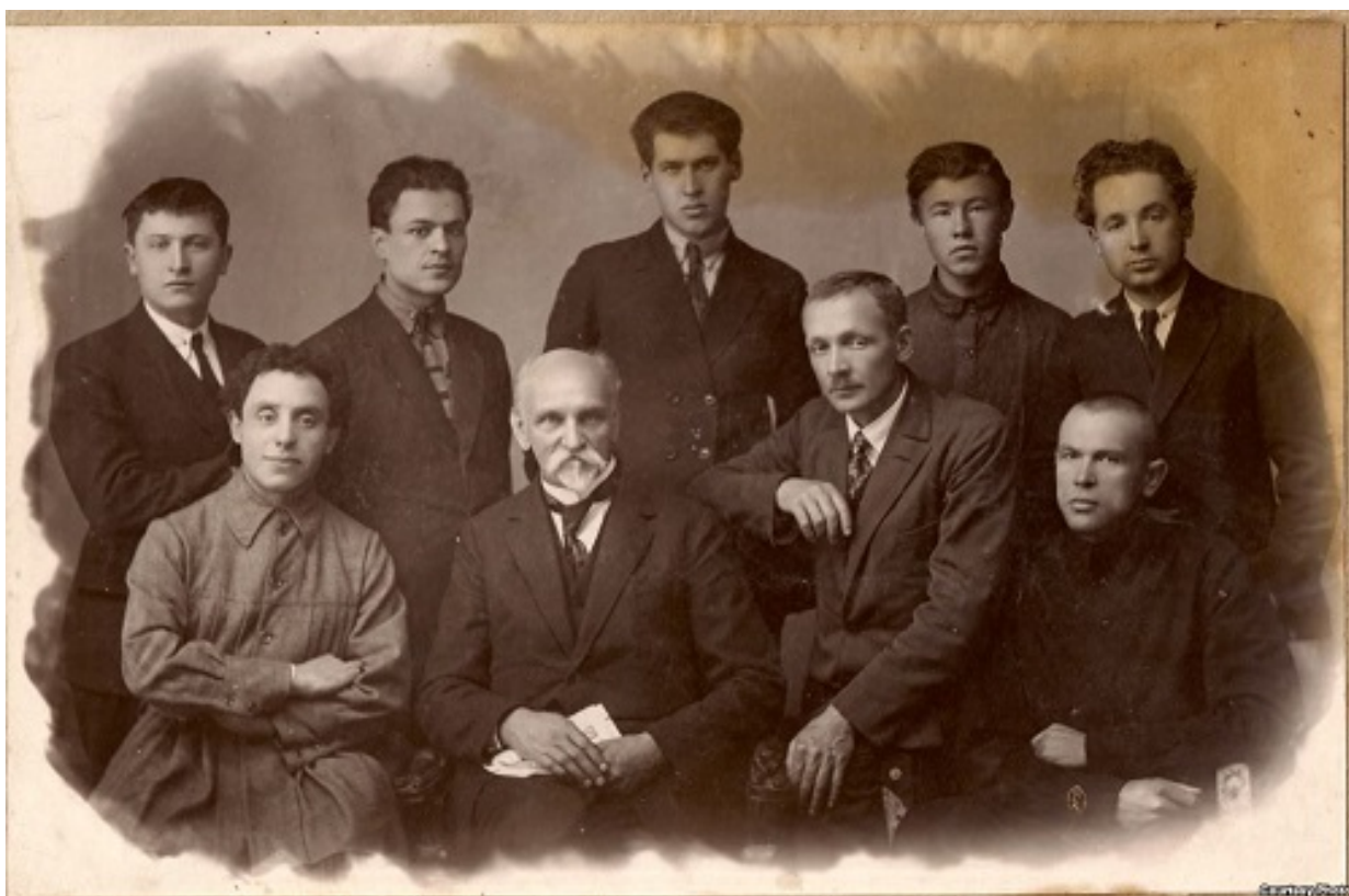
Беларускія пісьменнікі на сустрэчы з Янам Райнісам. Першы справа сядзіць Кандрат Крапіва, стаіць пасярэдзіне — Уладзімір Дубоўка. На фота можна знайсці Я. Пушчу, Я. Купалу, З. Бядулю і іншых. 19 лістапада 1926 года. З фондаў БДАМЛМ.