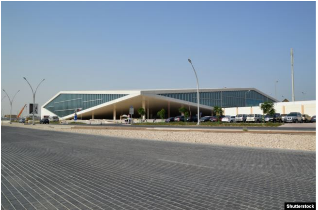
Будынак Нацыянальнай бібліятэкі Катара