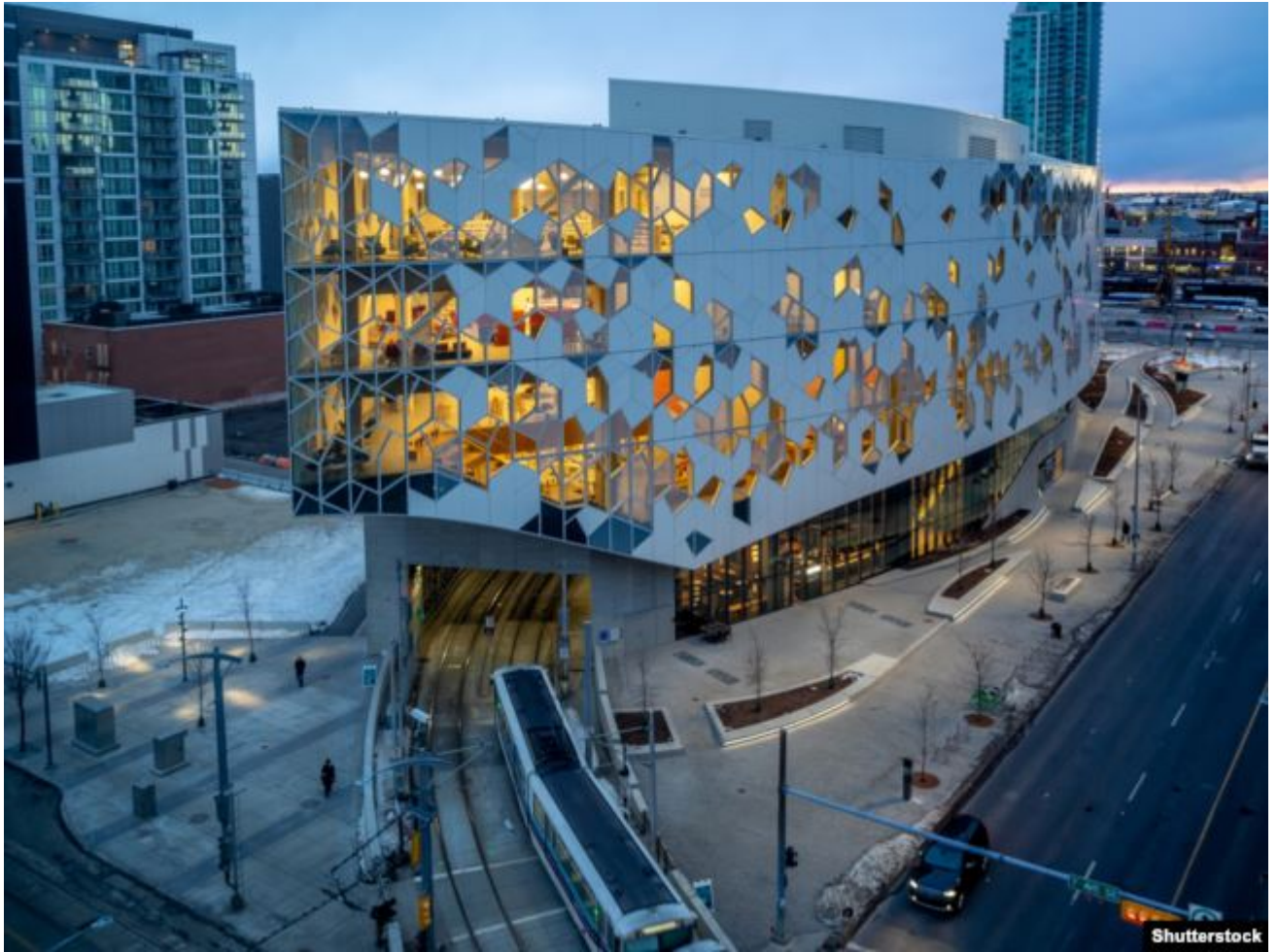
Новая центральная бібліятэка Калгары, Канада