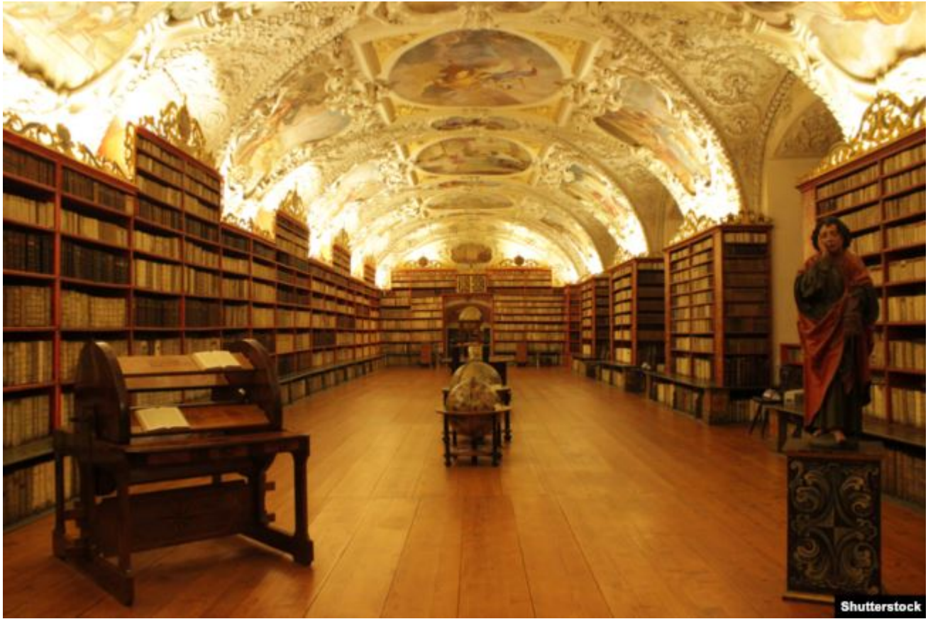
Чэшская нацыянальная бібліятэка, Клементыnum, Прага