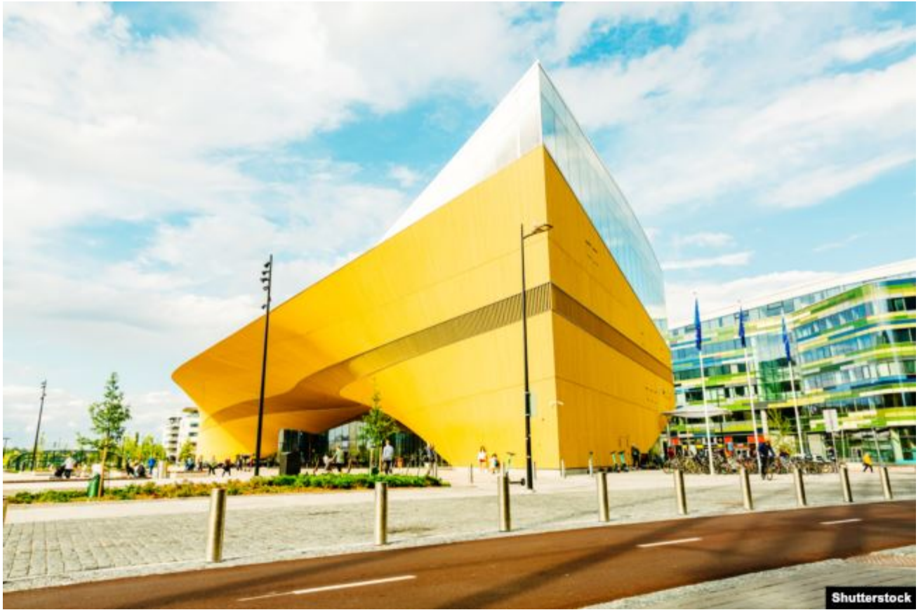
Бібліятэка Oodi, Хельсінкі, Фінляндыя