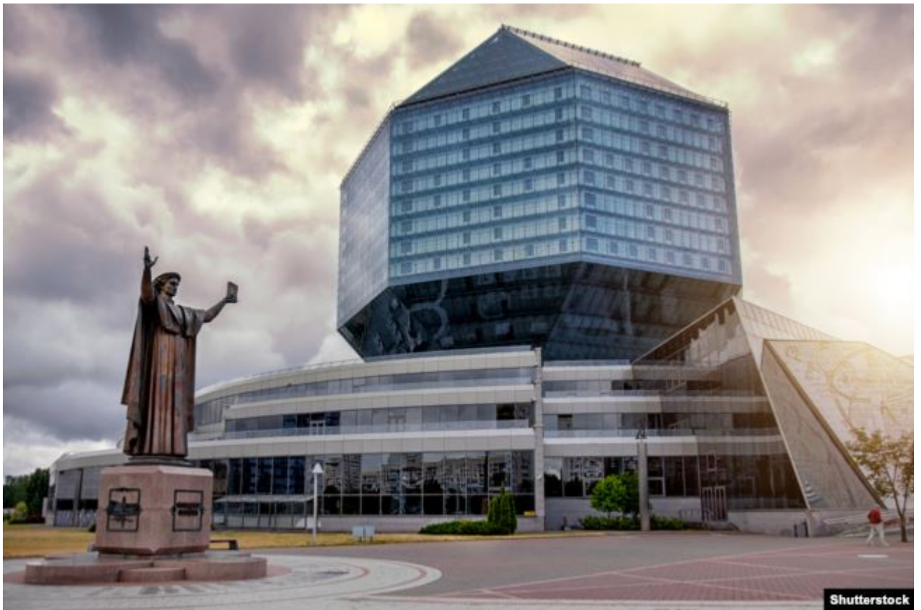
Нацыянальная бібліятэка Беларусі, Мінск