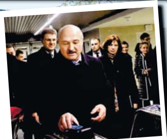
Церемония открытия 3-й линии метро. Ноябрь, 2020 год

Для улучшения и ускорения движения за последние примерно десять лет в городе построили целый ряд двухуровневых развязок и большой участок 1-го транспортного кольца. Он замкнул скоростную трассу на отрезке от улицы Тимирязева до улицы Толстого.