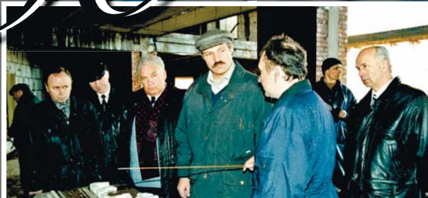
Президенту показывают макет будущего нового вокзала. Апрель, 1997 год

К долгостроям можно отнести и новый вокзальный комплекс в Минске, задуманный еще в середине 1970-х. До 1991 года возвели лишь высоту административно-служебного корпуса и зал ожидания (конкурс) над путями. До основного здания дело тогда так и не дошло. Когда же Беларусь полу-