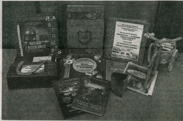
Матэрыялы бібліятэк-пераможцаў, прадстаўленыя да заахвочвання

Падрыхтавалі Наталля КАРНЕЙЧУК, вядучы бібліятэкар Нацыянальнай бібліятэкі Беларусі, Вольга КАКШЫНСКАЯ, галоўны бібліятэкар Нацыянальнай бібліятэкі Беларусі