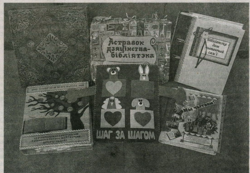
Матэрыялы бібліятэк-пераможцаў у намінацыі «За значны ўклад у выхавальную работу з падрастаючым пакаленнем»

У намінацыі «За падтрымку і развіццё чытання» першае месца сярод гарадскіх і раённых бібліятэк атрымала Гарадская бібліятэка сямейнага чытання Светлагорскага раёна за шматнараўную дзейнасць па далучэнні да чытання сем'яў праз выкарыстанне нестандартных формаў папулярнасці кнігі. Бібліятэка рэалізуе 12 творчых праектаў: інтэрв'ю-праект «Прачытай услед за мной!», інфармацыйна-прафілактычны праект «Выбар на карысць жыцця», валанцёрскі праект «Казачкі бай», летні праект «Кніжны дзенькі» і іншыя, у межах якіх арганізуюцца сямейныя выхадныя ў бібліятэку, пыжы ваімаўных медыаўроўкаў, конкурсы чытачоў і іншыя. Валікай папулярнасцю ў бібліятэцы карыстаецца куток беларускай кнігі, створаны ў межах бранд-праекта «Кніжныя падлічкі». Развіццё творчага кантакту з