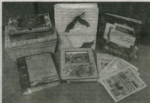
Матэрыялы бібліятэк-пераможцаў у намінацыі «За падтрымку і развіццё чытання»

Бібліятэкар скрупулёзна ажыццяўляе даследча-пошукавую працу па зборы матэрыялаў аб мясцовых дзеячах, жыццё і дзейнасць якіх звязаныя з родным краем. Наапазнаныя багатыя краяўдзельныя матэрыялы стаюць асновай для стварэння краяўдзельнага літаратурнага пакоя «Знакімныя людзі зямлі Жукоўшчыцкай», асвеціцкая якая ўключае архіўныя матэрыялы, копіі фрагментаў рукапісаў, лісты, фотаздымкі, копіі плакатаў і г.д. Абуджэнню ў дзяцей цікавасці і любові да роднай мовы і літаратуры, пісьменнікаў свай мясцовасці садзейнічае амаатарскае аб'яднанне «Пра».