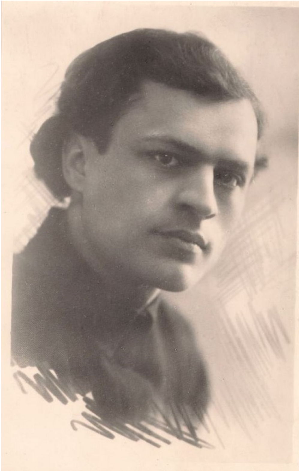
Адам Бабарэка. 1925 год.

Ён мала пражыў, але за кароткі тэрмін працы паспеў аказаць вялікі ўплыў на развіццё беларускай літаратуры, намагаючыся падняць яе на новы ўзровень. Так атрымалася, што адзін з выбітных літаратуразнаўцаў 1920-х гадоў не выдаў ніводнай сваёй кнігі крытыкі: артыкулы яго засталіся рассыпанымі па перыядычных выданнях – «Савецкай Беларусі», «Маладняку» і «Узвышшы». Ён загінуў у 1938-м – памёр у лагернай бальніцы, і яго асабовую справу здалі ў архіў 139-й.