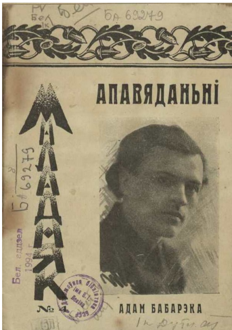
«Апавяданні» (1925).

Для Бабарэкі «маладнякізм» быў рухам, які пазіцыянаваў калектыўную мастацка-літаратурную сілу, адмаўленне ад індывідуальнага погляду мастака на свет. У гэты час ад пісьменнікаў «жорстка патрабуюць пэўных тэм, раскрытых пэўнымі мастацкімі сродкамі. Партыйная крытыка катэгарычна дыктуе жанры і падыходы. Знікае само паняцце свабоды творчасці – якраз тады, калі пісьменнікі выходзяць на той ўзровень, калі гэта свабода найбольш патрэбная» (Г. Севярынец).