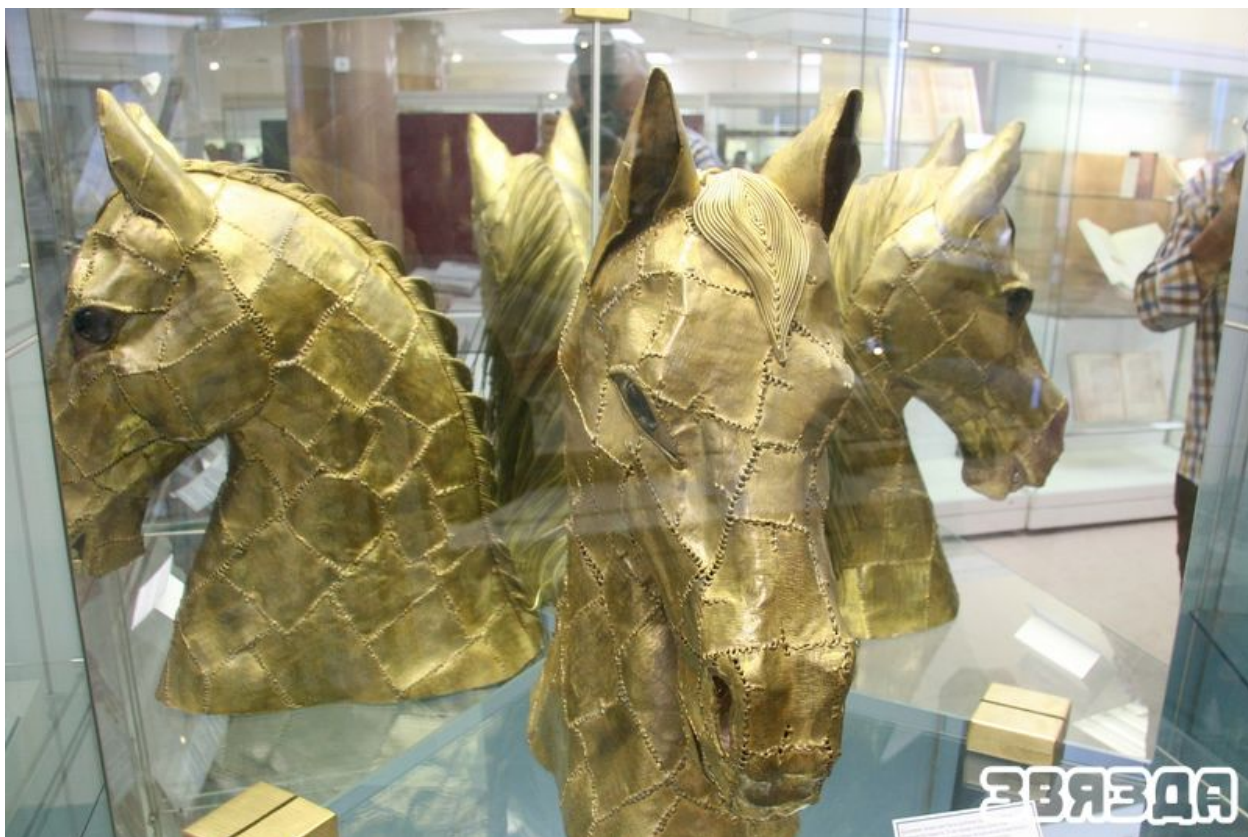
Бронзавая галава каня (Лусіян Бустамантэ, XX ст.).