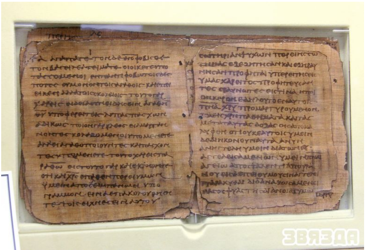
Папірус Бадмера, Паслання апостала Петра, III ст. (факсімільнае выданне).