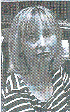
Галоўны бібліятэкар Нацыянальнай бібліятэкі Беларусі