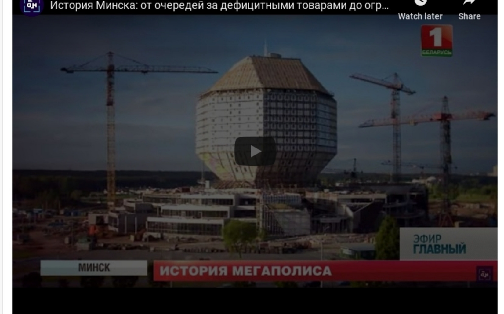
МИНСК ИСТОРИЯ МЕГАПОЛИСА ЭФИР ГЛАВНЫЙ

При участии горожан город стал таким, каким мы его видим сегодня: уютным, зеленым, просторным. Наверное, свои эпитеты есть у каждого. И в такие моменты, прогуливаясь по любимым улицам или общаясь с друзьями на любимой террасе, всегда полезно оглянуться назад. И вспомнить историю современного мегаполиса. А была она весьма непростой. От гигантских очередей за дефицитными товарами, поросших бурьяном площадей в центре города до огромных торговых комплексов, от пригородных деревень к комфортным микрорайонам и знаковым объектам для всей страны.