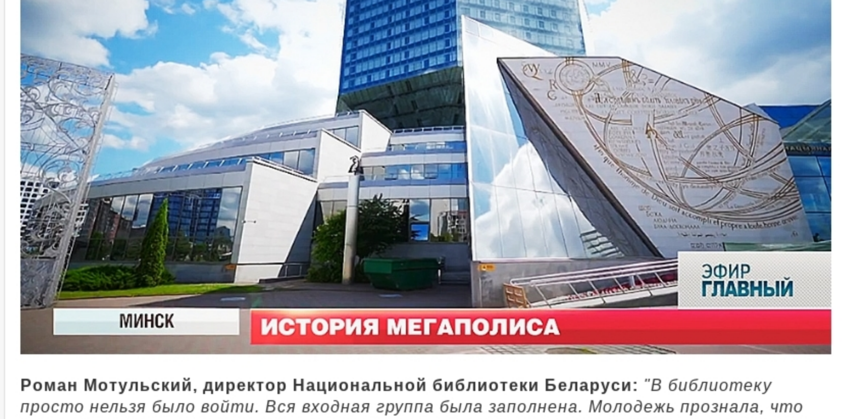
МИНСК ИСТОРИЯ МЕГАПОЛИСА ЭФИР ГЛАВНЫЙ