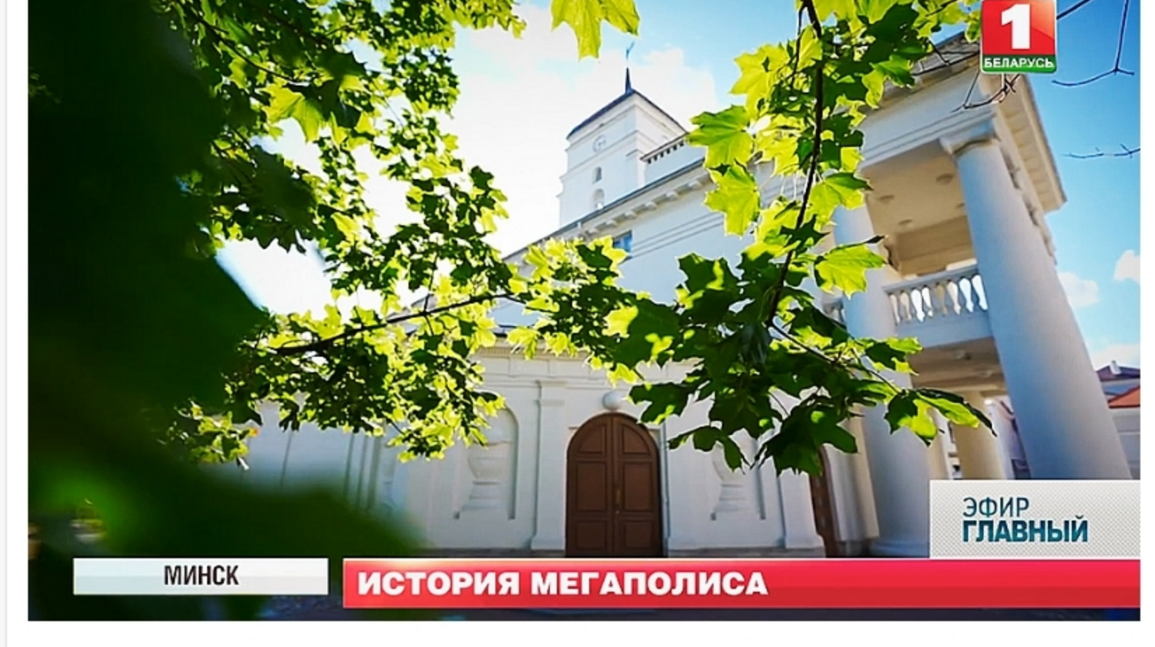
МИНСК ИСТОРИЯ МЕГАПОЛИСА ЭФИР ГЛАВНЫЙ

Почти два десятилетия назад городскую Ратушу, разрушенную еще в XIX веке, восстановили по сохранившимся изображениям. И это был не просто туристический проект.