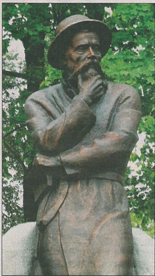
Помнік Ф. Багушэвічу ў г. Смаргоні.