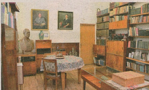
Мемарыяльны кабінет Пятра Глебкі.

Тэму ўшанавання маладнякоўцаў на іх малой радзіме працягнулі