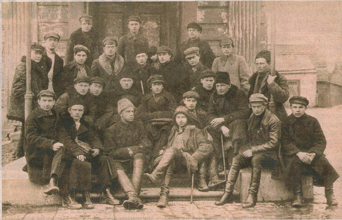
Сябры літаб’яднання “Маладняк”.