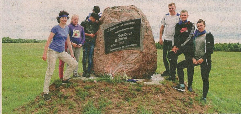
Удзельнікі велапрабегу “Па мясцінах Дубоўкі”.

вядомага земляка Міхася Зарэцкага, 120-годдзе з дня нараджэння якога адсвяткавалі летась. Хаця праявілі нарэшце ў Талачынскім раёне, але яго станаўленне як асобы і творцы непасрэдна звязана са Шклоўшчынай. Тут, у вёсцы Зарэчка ля Шклова, прайшло яго дзяцінства, пасля таго як у тутэйшую царкву быў прызначаны служыць дзякам бацька будучага пісьменніка. Менавіта ад назвы вёскі ўзнік і сам літаратурны псеўданім Міхася Касянкава.