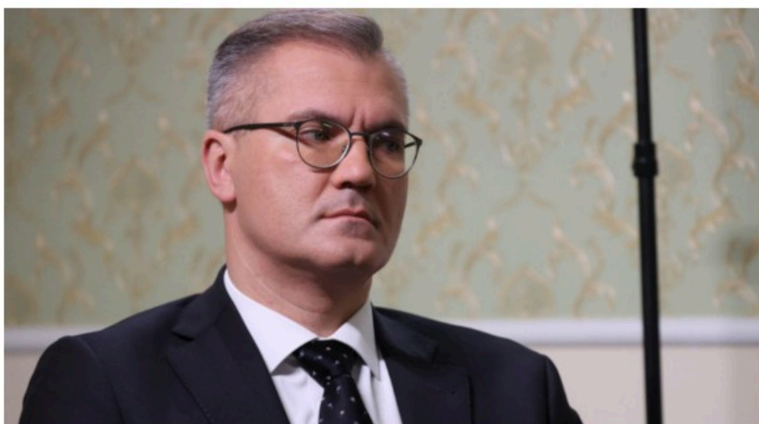
Вадим Гигин. Фото из архива