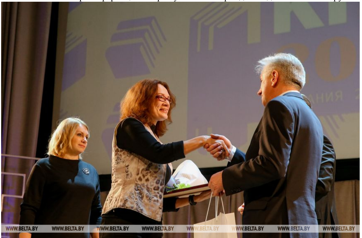
Заместитель министра информации Игорь Бузовский награждает издательский дом "Беларусь сегодня"