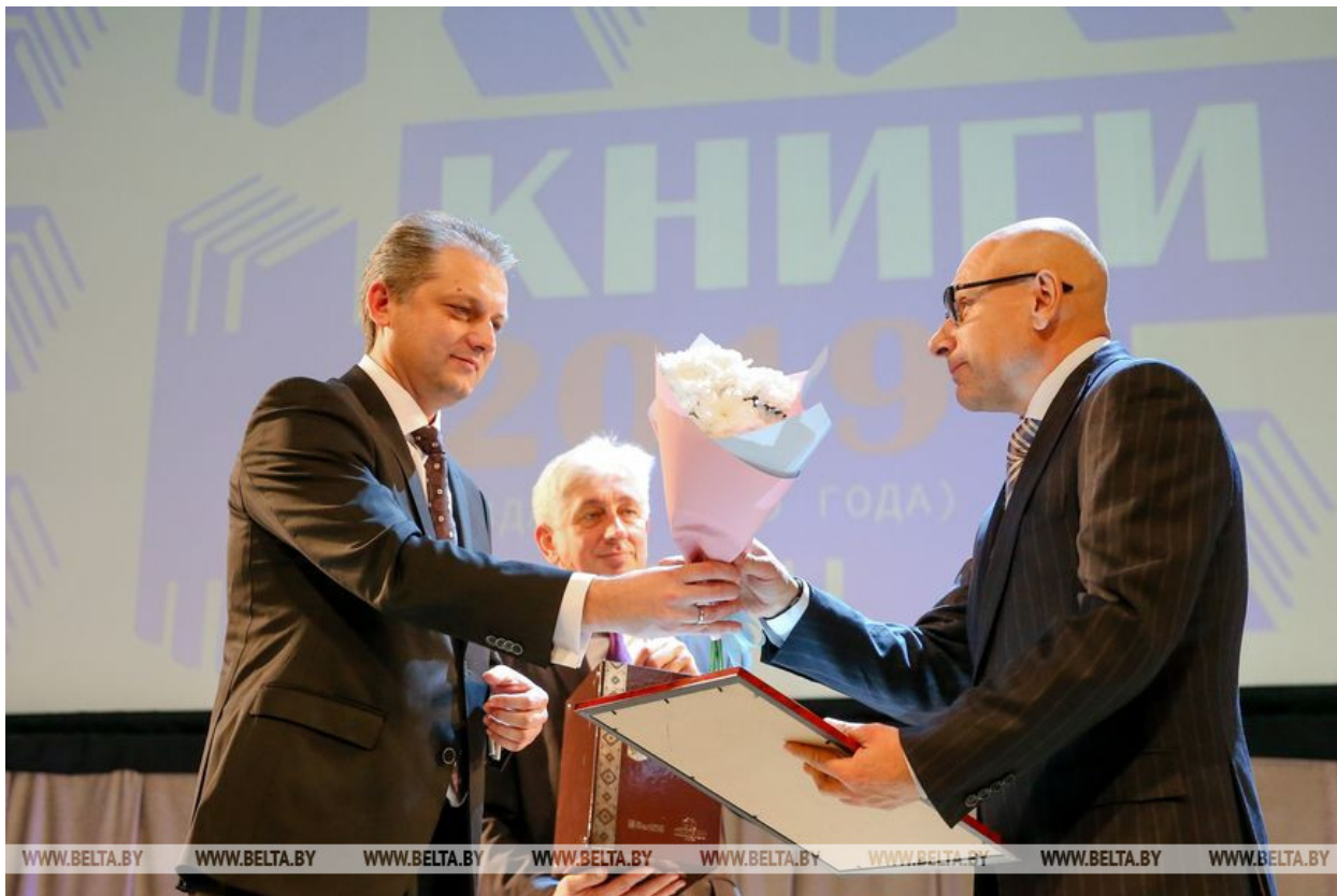
Заместитель министра информации Игорь Бузовский награждает издательство "Аверсэв".

преподнесли сюрприз Бельничской вспомогательной школе-интернату - библиотечку детской литературы. К слову, именно Бельниччи примут в 2020 году День белорусской письменности. Также состоялся показ спектакля-мюзикла "Песняр" актерами Национального академического драматического театра имени М.Горького. Постановка посвящена народному артисту СССР Владимиру Мулявину, благодаря которому белорусская поэзия и песня стали частью мировой культуры.-0-