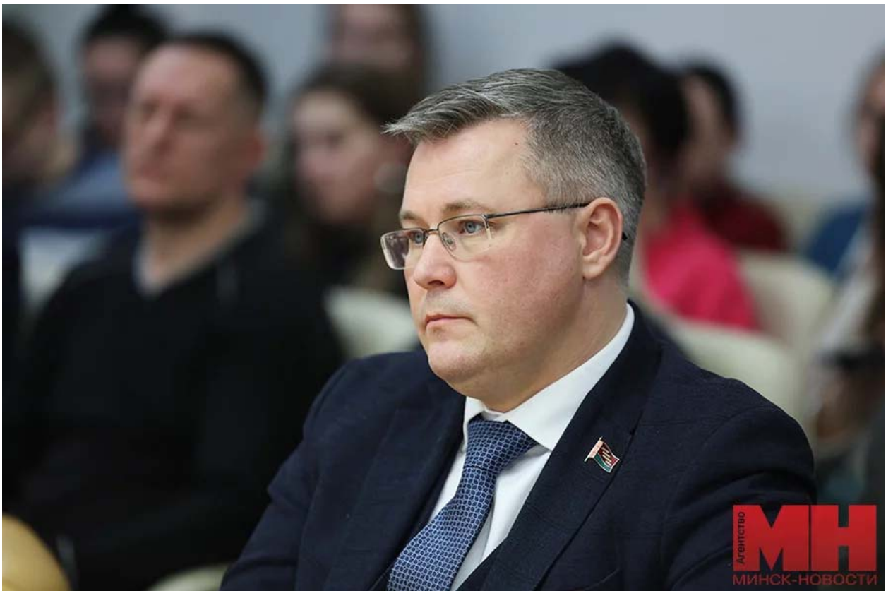
Глава Национальной библиотеки рассказал о том, как зародилась идея о написании очерка.