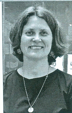
Загадчык сектара Нацыянальнай бібліятэкі Беларусі

1 верасня 2021 г. Музей кнігі Нацыянальнай бібліятэкі Беларусі святкуе 15-годдзе дзейнасці. Музей кнігі – знакавая экспазіцыйная прастора, якая з’явілася ў новым будынку галоўнай бібліятэкі краіны ў 2006 г. За час сваёй працы ён стаў яркай візітоўкай Нацыянальнай бібліятэкі Беларусі. З нагоды юбілею ў Музеі кнігі створана выстава «5 + 5 + 5».