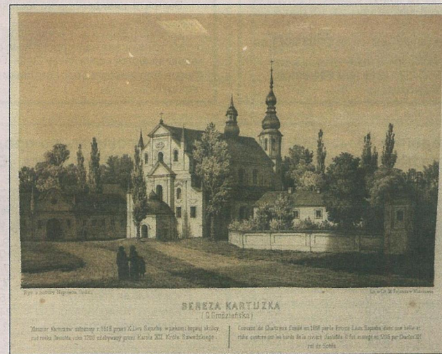
Кожны малюнак меў гістарычны каментарый.

МАТУЛЬСКИ, Напалеон Орда аказаўся тым чалавекам, які з дафатаграфічнай эпохі фактычна данёс фатаграфію тых часоў. З дакументальнай дакладнасцю ён перадаваў выявы замкаў, палацаў, сядзіб, храмаў, краявідаў. Сёння яго спадчына — цікавая і каштоўная крыніца для рэстаўратараў, гісторыкаў, мастацтвазнаўцаў, краязнаўцаў, іншых даследчыкаў з Беларусі, Літвы, Латвіі, Польшчы, Украіны —