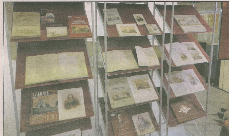
У фондах Нацыянальнай бібліятэкі захоўваецца багата кніг.