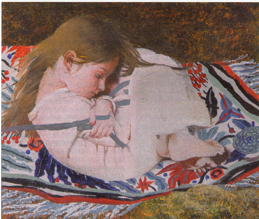
«Сон у летні дзень»