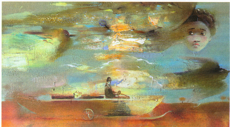
«Рух да мары»

І сапраўды так. Асабіста мяне экспазіцыя вельмі ўразіла, і ад карцін, з якімі знаёмлю чытача, не хацелася адыходзіць: столькі ў іх сонца, радасці і хваласпеваў Таму, хто стварыў нас і падарыў магчымасць адчуваць гэтае шчасце і жыццё наогул.