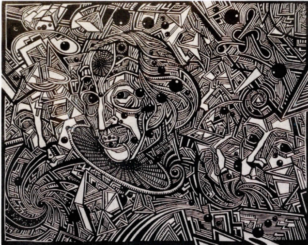
«Метамарфозы. Кампазіцыя № 603», 1992—1993 гг.

Уладзімір Хін (творчы псеўданім Уладзіміра Правідохіна) — аўтар больш як чатырох тысяч работ, многія з якіх знаходзяцца цяпер у музеях, галерэях, цэнтрах мастацтваў Беларусі, Расіі і іншых краін. Мастак актыўна ўдзельнічае ў рэспубліканскіх і міжнародных выстаўках эстампа і малюнка, конкурсах плаката, у рэгіянальных выставачных праектах