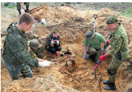
Удзельнікі пошукавага клуба “Вікрю” падчас экспедыцыі.