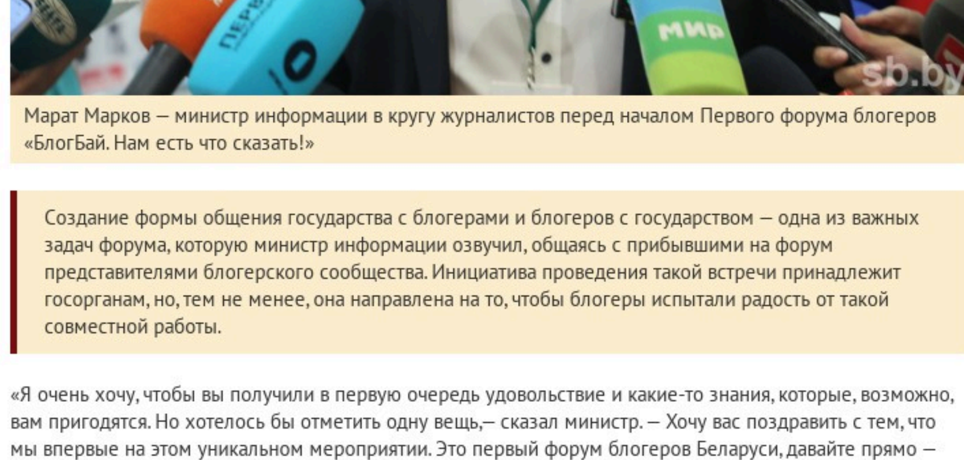
Марат Марков – министр информации в кругу журналистов перед началом Первого форума блогеров «БлогБай. Нам есть что сказать!»

А вот что сказал, обращаясь к участникам в день открытия форума, министр информации Марат Марков : «Сегодняшнее мероприятие в своем роде уникальное. Во-первых, мы впервые проводим форум блогеров. Во-вторых, аудитория всех участников форума, которые уже давно являются блогерами или только начинают продвигаться в этой сфере, наставников и менторов, экспертов суммарно составляет более 27 миллионов человек. И это только те, кого мы посчитали. Наверняка их гораздо больше». В этой связи министр информации обратил внимание блогеров, что на них ориентируется аудитория: «Хочу, чтобы вы помнили, что люди, подписанные на ваши каналы и соцсети, ориентируются на вас, они слушают вас, сверяют свои риски с вашими. Это накладывает определенную ответственность. У нас с вами есть Беларусь. Прекрасная страна, и другой такой земли у нас с вами точно не будет. И для того, чтобы она оставалась такой же красивой, все надо порабатать. И не только Министерству информации, Министерству образования и ведомств, а всем нам в первую очередь». Кроме того, и такую мысль выразил перед открытием форума Марат Марков: «Я очень хочу, чтобы тем, кто участвует в мероприятии, а оно действительно уникальное, оно настолько понравилось, чтобы они сказали: министерство, делайте еще».