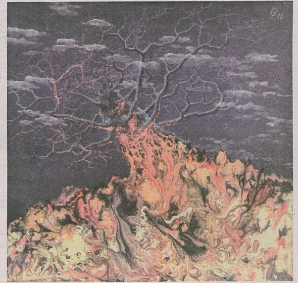
Сяргей Пыжыкаў «Памкненне», 2016 г.