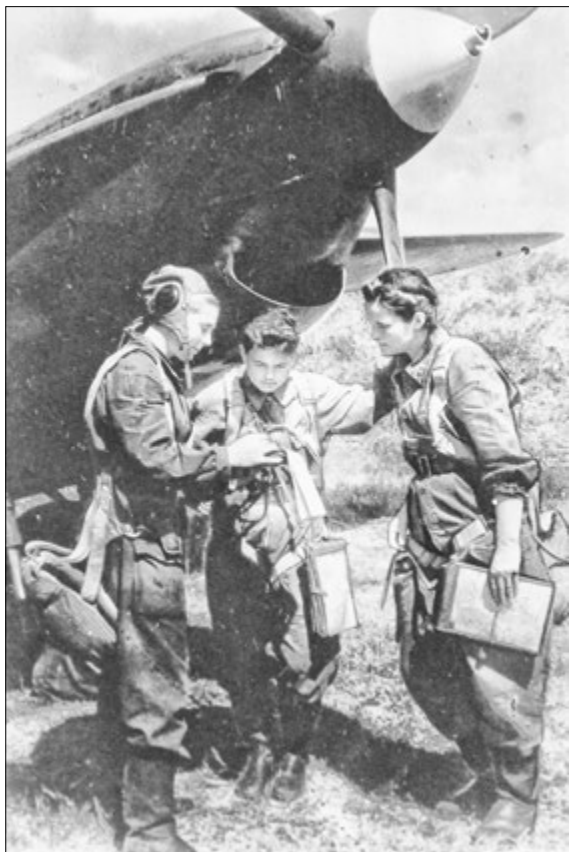
Раскова першай з жанчын-лётчыц здзейсніла бесперасадачны авіяпералёт Масква—Далёкі Усход. Загінула ў студзені 1943 года.

Лётчыца-штурман Марына Раскова — адна з першых жанчын, якая атрымала званне Героя Савецкага Саюза і дабілася ў вярхоўнага камандавання дазволу на фарміраванне жаночых баявых часцей — трох авіяпалкоў, у тым ліку знакамітых «начных ведзьмаў».