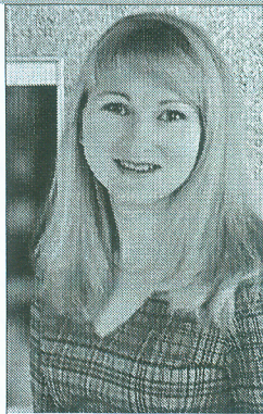
Главный библиограф Национальной библиотеки Беларуси