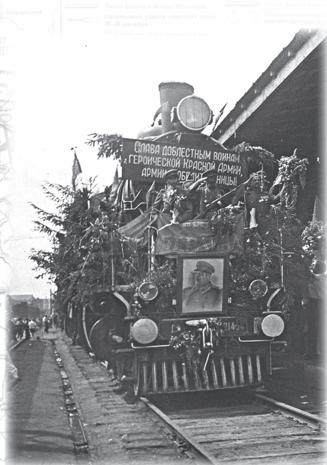
Возвращение советских солдат на Родину

Мы помним о почти полностью разрушенном Минске, других городах и населённых пунктах. Знаем, что люди выходили на расчистку зданий, сооружений, улиц, площадей. Но оказывается, завалы аккуратно разбирались. В одной из статей автор пишет, что по всему Минску видны выбранные из руин и сложенные в штабеля кирпичи, горки металлолома, радиаторов – всё это готовилось для повторного использова-