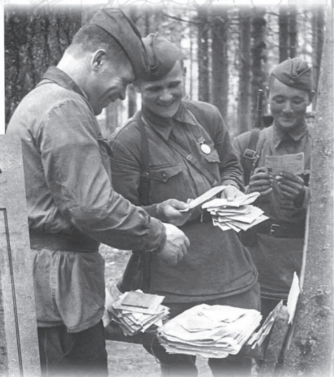
Раздача писем, Московская область, 1942 г.