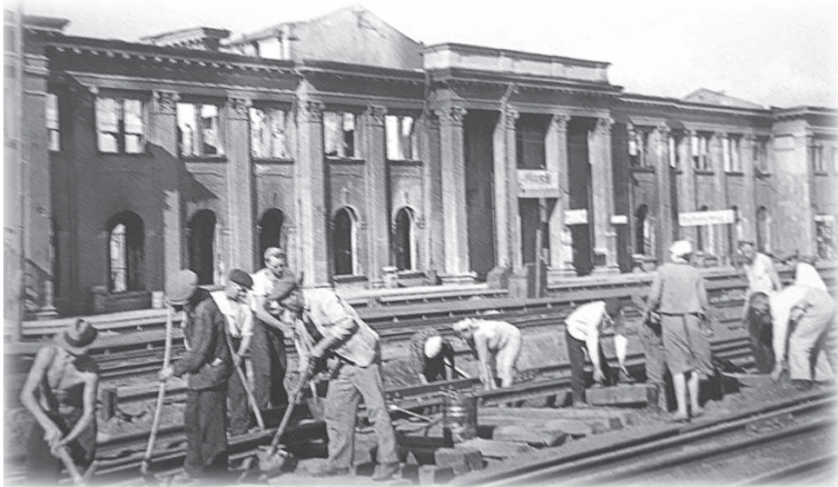
Восстановление железнодорожного вокзала в Минске