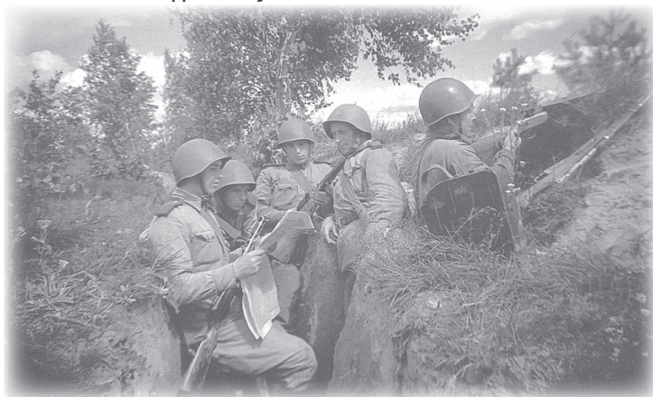
Западный фронт, август 1943 г.

и их сообщников и причинённого ими ущерба гражданам, колхозам, общественным организациям, государственным предприятиям и учреждениям СССР» 9 .