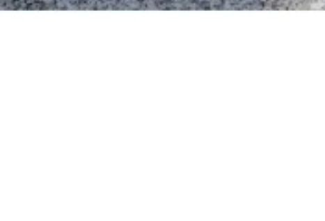
Фото: Александр КУШНЕР