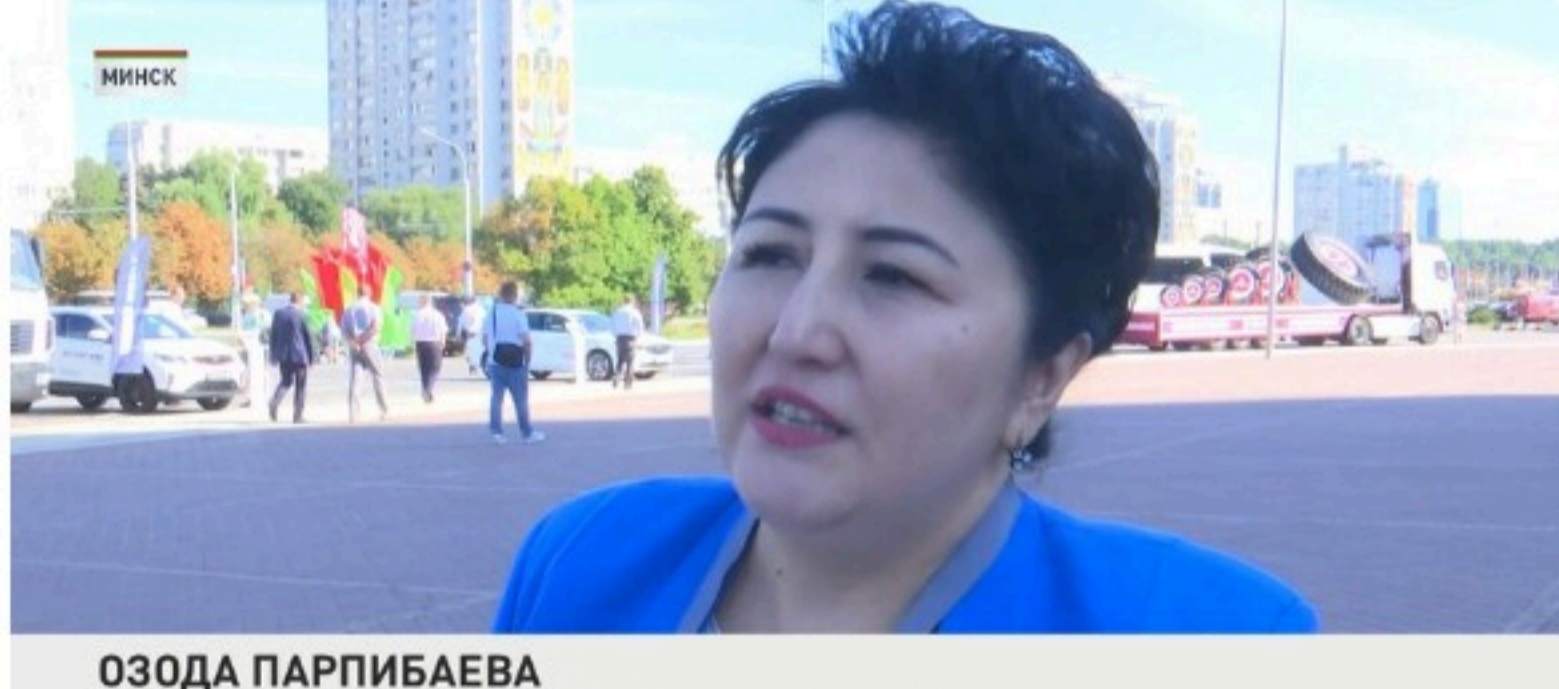
ОЗОДА ПАРПИБАЕВА ПРЕДСЕДАТЕЛЬ ГОСКОМИТЕТА ПО ДЕЛАМ СЕМЬИ И ЖЕНЩИН УЗБЕКИСТАНА

На значимое мероприятие форума собрались более 500 человек. Здесь работает большая экспозиция, на которой представлены достижения различных предприятий нашей страны. На площадке под открытым небом представили нашу технику: от линейки спецтранспорта до передвижной медицинской лаборатории. А уже внутри – стелажы с национальным достоянием двух стран. Это продукция легпрома, сувениры.