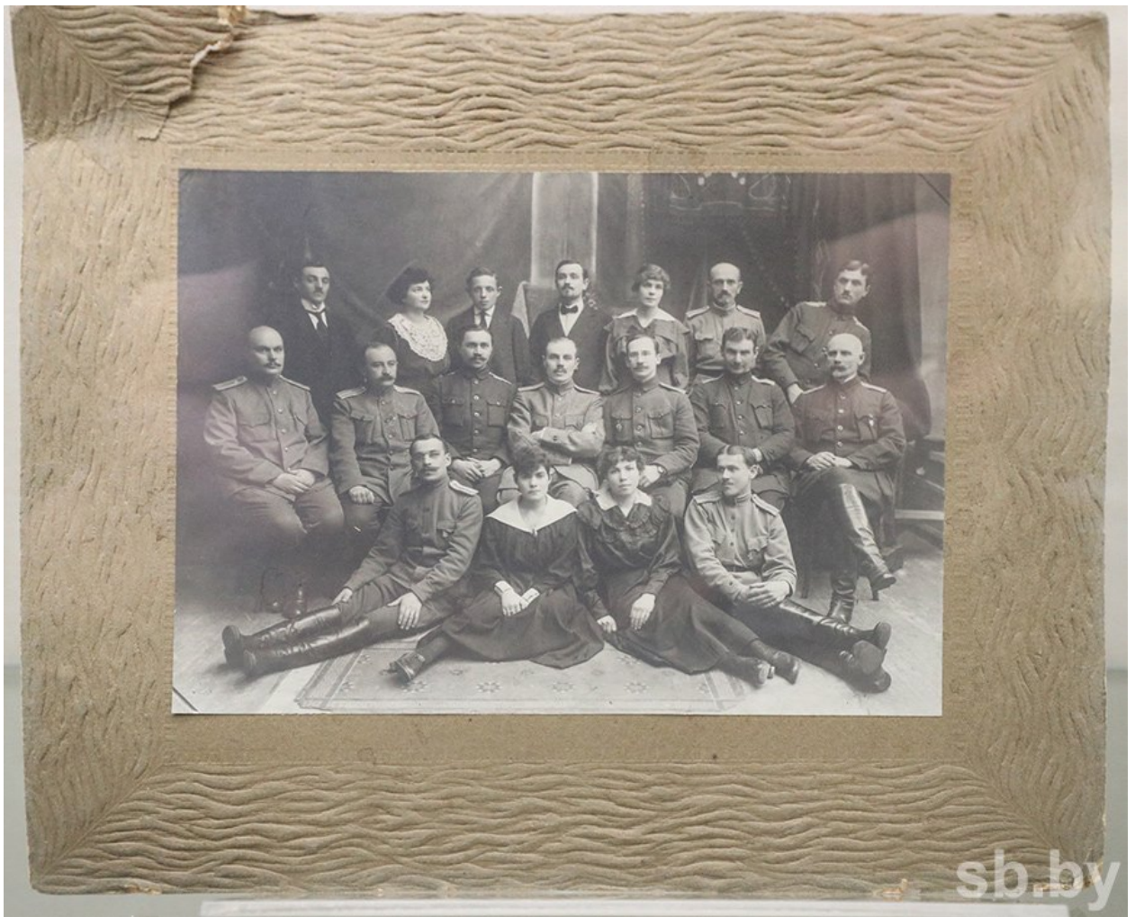
Полоцк. Перед немецкой оккупацией, 1917 г.