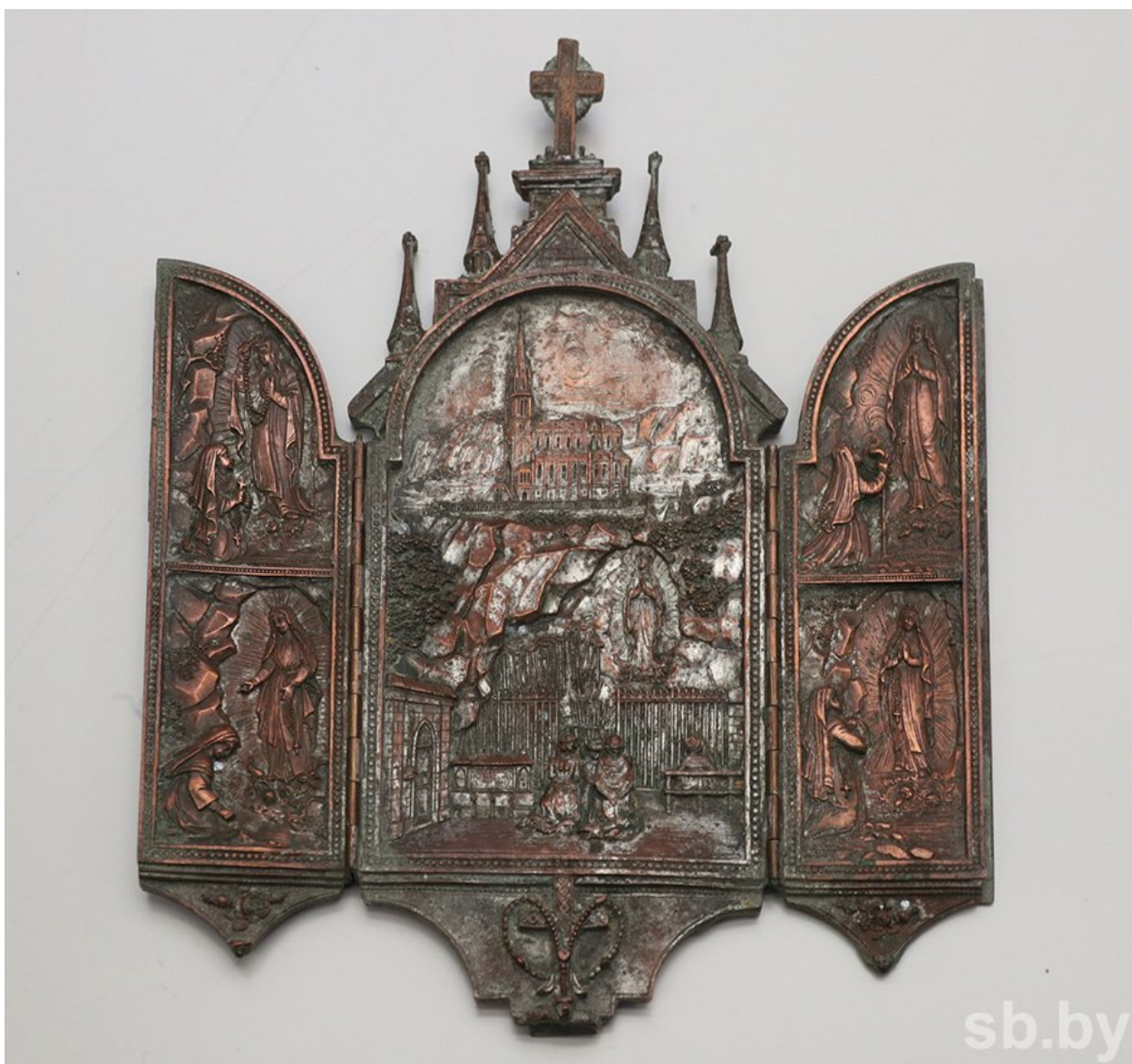
Уникальный католический складень.

— Какие еще экспонаты вы предложили в экспозицию?