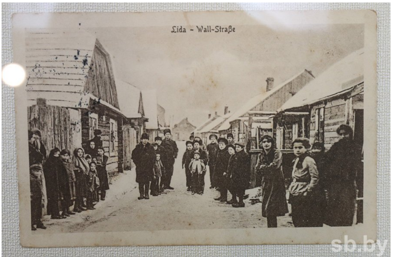
Лида. Открытка из этнографической коллекции.

Что касается поручика Кононова, судя по всему, тот был весьма ответственным офицером и специалистом, поскольку возил с собой целую библиотеку артиллериста. Эти книжки, а также некоторые личные вещи поручика также экспонируются. Как и письменный прибор коменданта Гродненской крепости генерала Кайгородова.