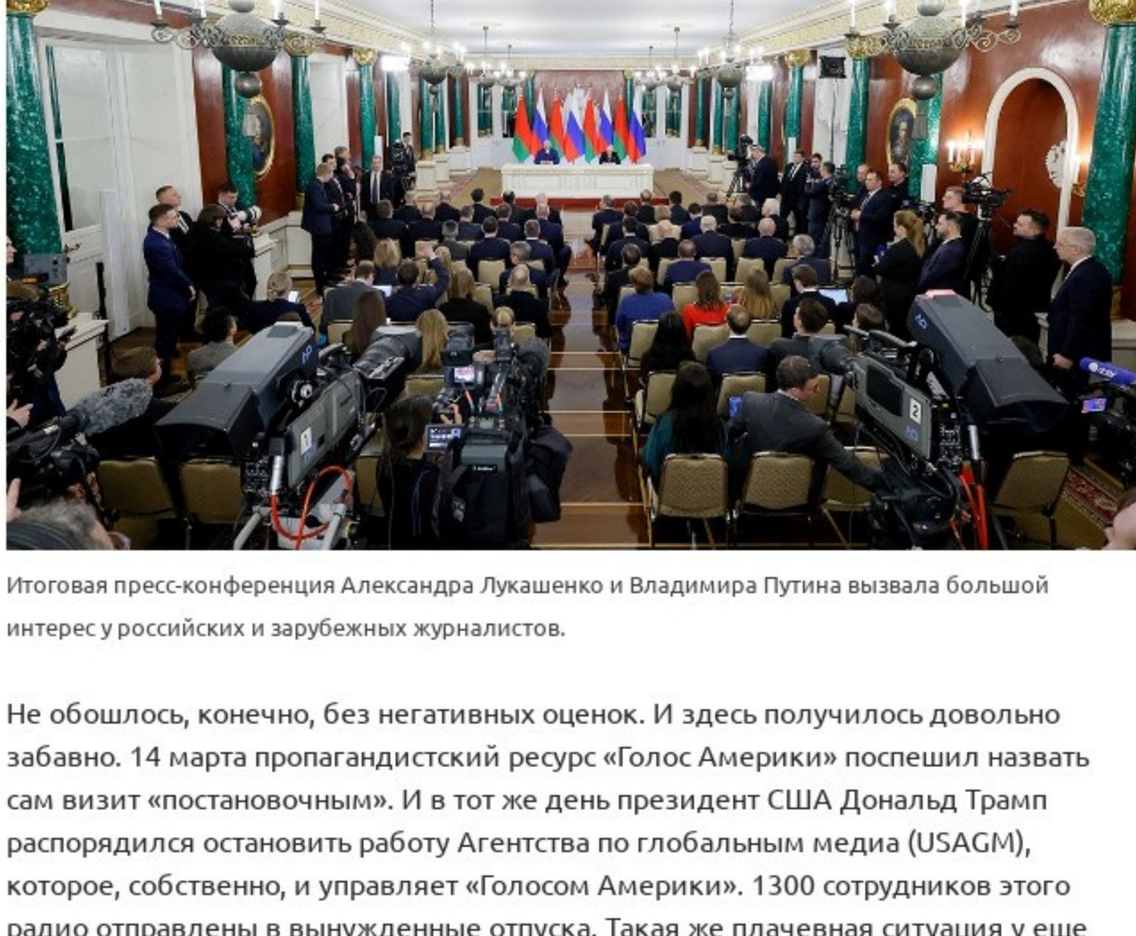
Итоговая пресс-конференция Александра Лукашенко и Владимира Путина вызвала большой интерес у российских и зарубежных журналистов.

Официальный визит Президента Беларуси в Россию оказался настолько информационно насыщенным, что вызвал целую волну комментариев в прессе, в том числе и западной. И она не спадает на протяжении нескольких дней, несмотря на интенсивность новостной повестки. А ряд заявлений и оценок Александра Лукашенко заставляет аналитиков из Европы и США делать далекие выводы. Впрочем, нашлось место и для конспирологии.