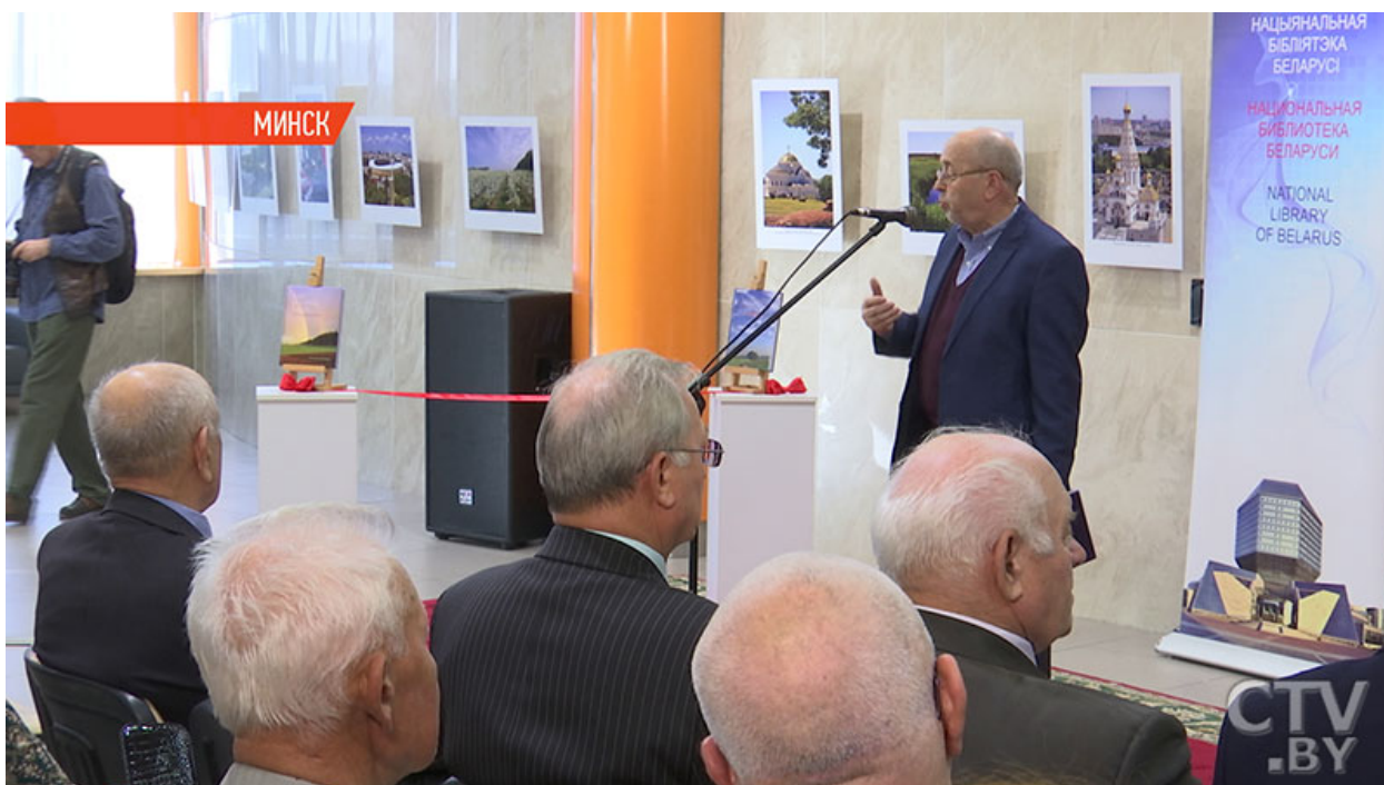
Фото. Книгу «Бачу Беларусь такой» с фотографиями Владислава Цыдика презентовали в Минске