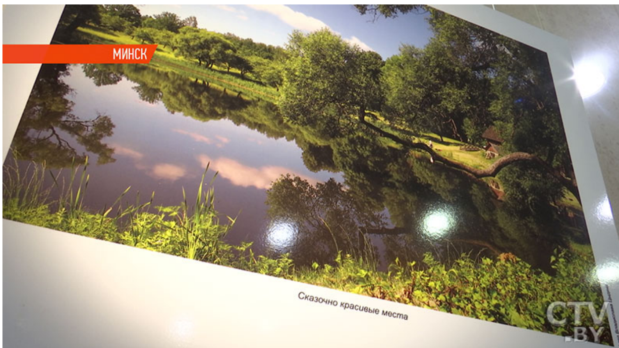
Фото. Книга «Бачу Беларусь такой» с фотографиями Владислава Цыдика