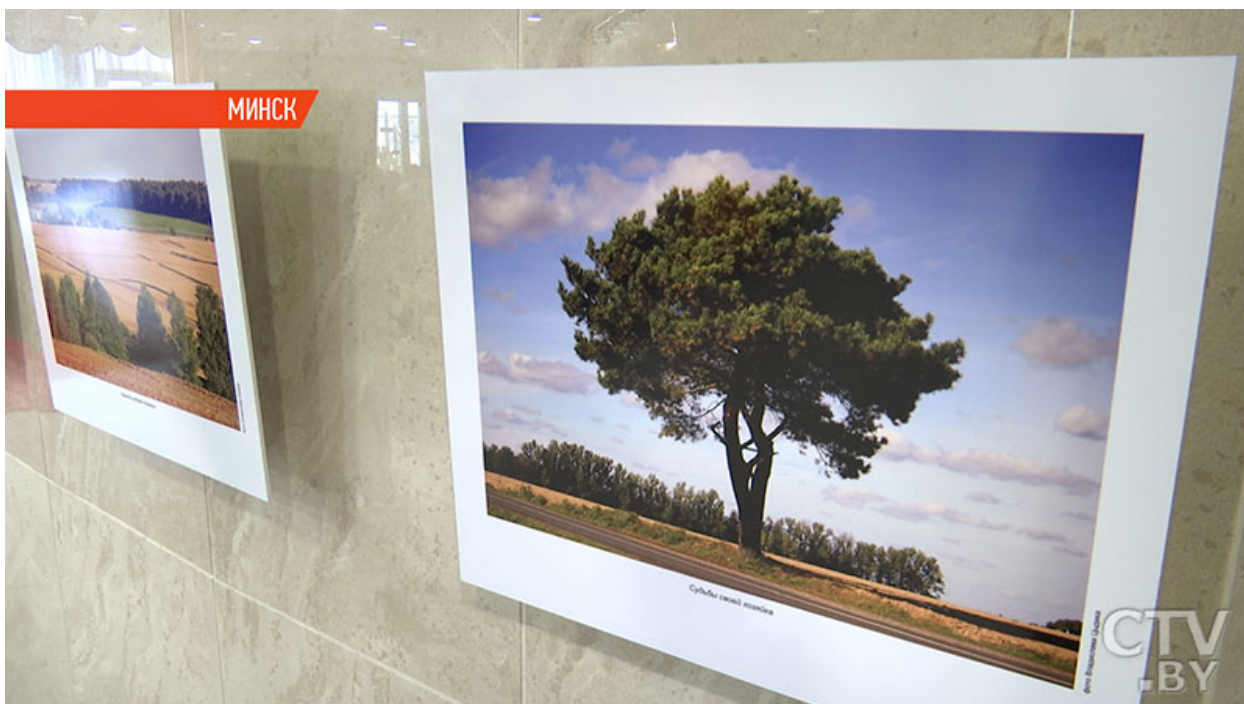
Фото. Книгу «Бачу Беларусь такой» с фотографиями Владислава Цыдика презентovali в Минске