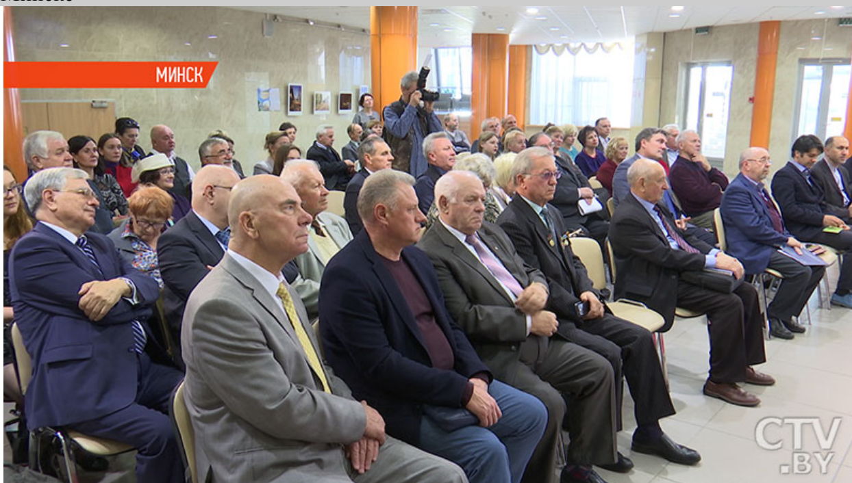
Фото. Книгу «Бачу Беларусь такой» с фотографиями Владислава Цыдика презентovali в Минске