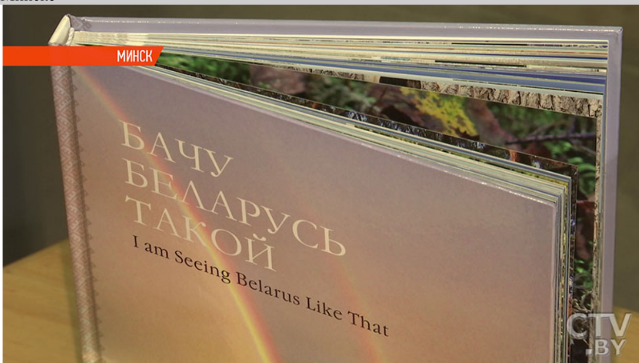
Фото. Книга «Бачу Беларусь такой» с фотографиями Владислава Цыдика