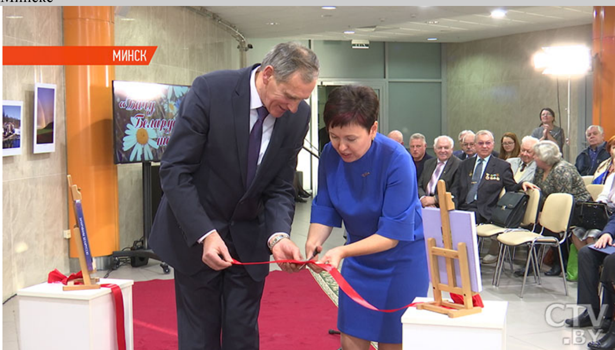
Фото. Книгу «Бачу Беларусь такой» с фотографиями Владислава Цыдика презентовали в Минске