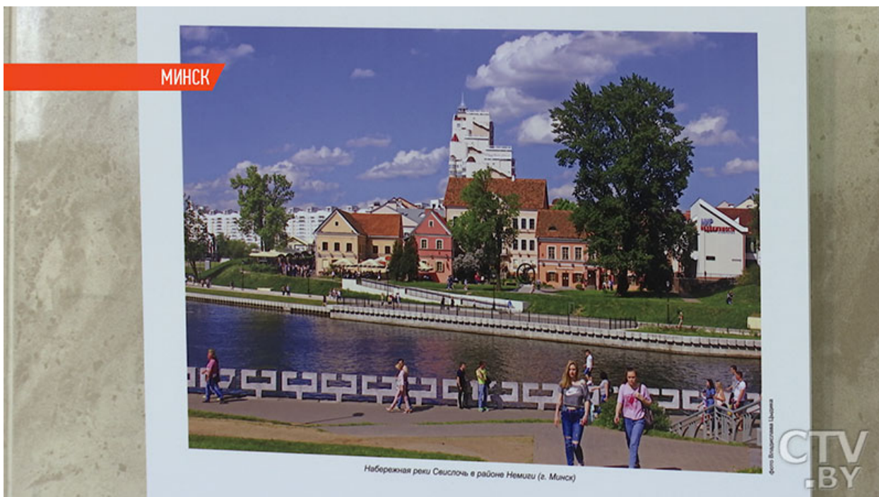
Фото. Книгу «Бачу Беларусь такой» с фотографиями Владислава Цыдика презентовали в Минске