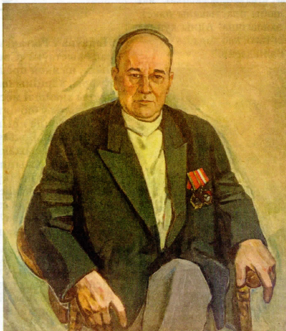
Уладзімір Кухараў «Комісар 1-й Беларускай партызанскай брыгады Шкрэда Р. В.», 1975 г.

часам на розных пляцоўках, у галерэі Нацыянальнай бібліятэкі ў тым ліку, і самі былі сведкамі ваенных падзей. Хтосьці прымаў удзел у баявых дзеяннях, нехта змагаўся ў партызанскіх атрадах, іншым давялося выжываць у акупацыі ці эвакуацыі.