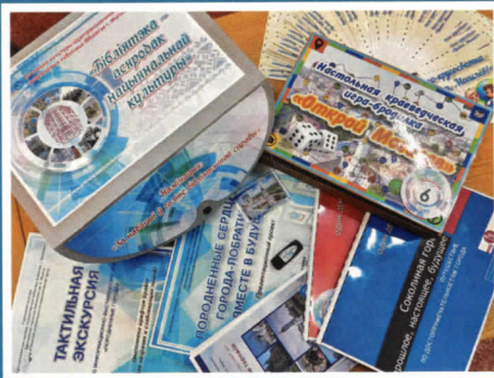
Махаўская сельская бібліятэка Магілёўскай вобласці.