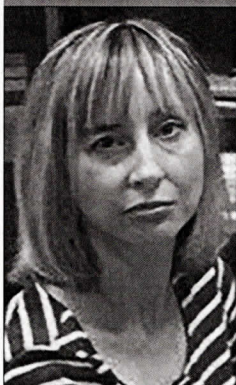
Галоўны бібліятэкар Нацыянальнай бібліятэкі Беларусі