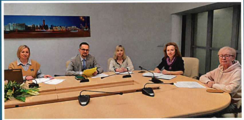
Журы XXXII Рэспубліканскага конкурсу «Бібліятэка – асяродак нацыянальнай культуры».