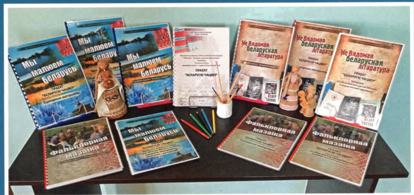
Іўеўская раённая бібліятэка Гродзенскай вобласці.