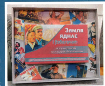
Ляхавіцкая цэнтральная раённая бібліятэка імя Янкі Купалы Брэсцкай вобласці.