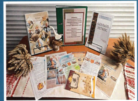
Адэльская сельская бібліятэка – цэнтр краязнаўства і турызму Гродзенскай вобласці.