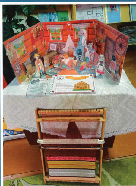
Чурлёнская сельская інтэграваная бібліятэка Мінскай вобласці.