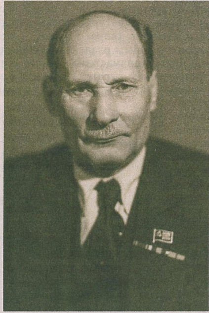
Якуб Колас. 1946-1947 гг.

Асабліва плённа ў юбілейны год працаваў Дзяржаўны літаратурна-мемарыяльны музей Якуба Коласа. У музеі Песняра праходзілі не толькі экскурсіі, але і імпрэзы, канферэнцыі, круглыя сталы, тэатралізаваныя прадстаўленні, прысвечаныя жыццю і творчасці пісьменніка. Упершыню прайшоў фестываль дзіцячай кнігі «Міхасёвы прыгоды» пры падтрымцы выдавецкага дома «Звязда» і Саюза пісьменнікаў Беларусі. Прэзентацыя факсімільнага выдання паэтычнага зборніка Якуба Коласа «Водгудле», які пабачыў свет 100 гадоў таму, і выхад кнігі «Табой я жыў, табой жыву. Пра жонку Якуба Коласа», якая аб'яднала матэрыялы з фондаў музея і прыватнага архіва нашчадкаў паэта, сталі знакавымі вехамі дзейнасці музея.