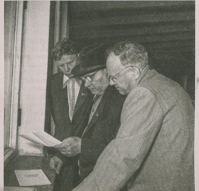
Якуб Колас, Максім Танк, Пятрусь Броўка ў перарыве на III сесіі Вярхоўнага Савета БССР 4-га склікання. Мінск, 1956 г.

Праект «Ад усяго сэрца, ад усёй душы: інскрыпты Якуба Коласа на кнігах» ажыццяўляўся ў музеі Песняра на працягу 2022 года. Кожны месяц