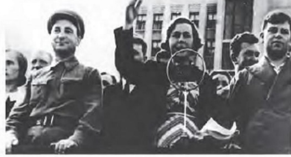
На митинге в Минске по поводу освобождения Западной Беларуссии. Председатель Верховного Совета БССР Н.Г. Грекова и первый секретарь ЦК Компартии Беларуссии П.К. Пономаренко. 1939 г. ▶