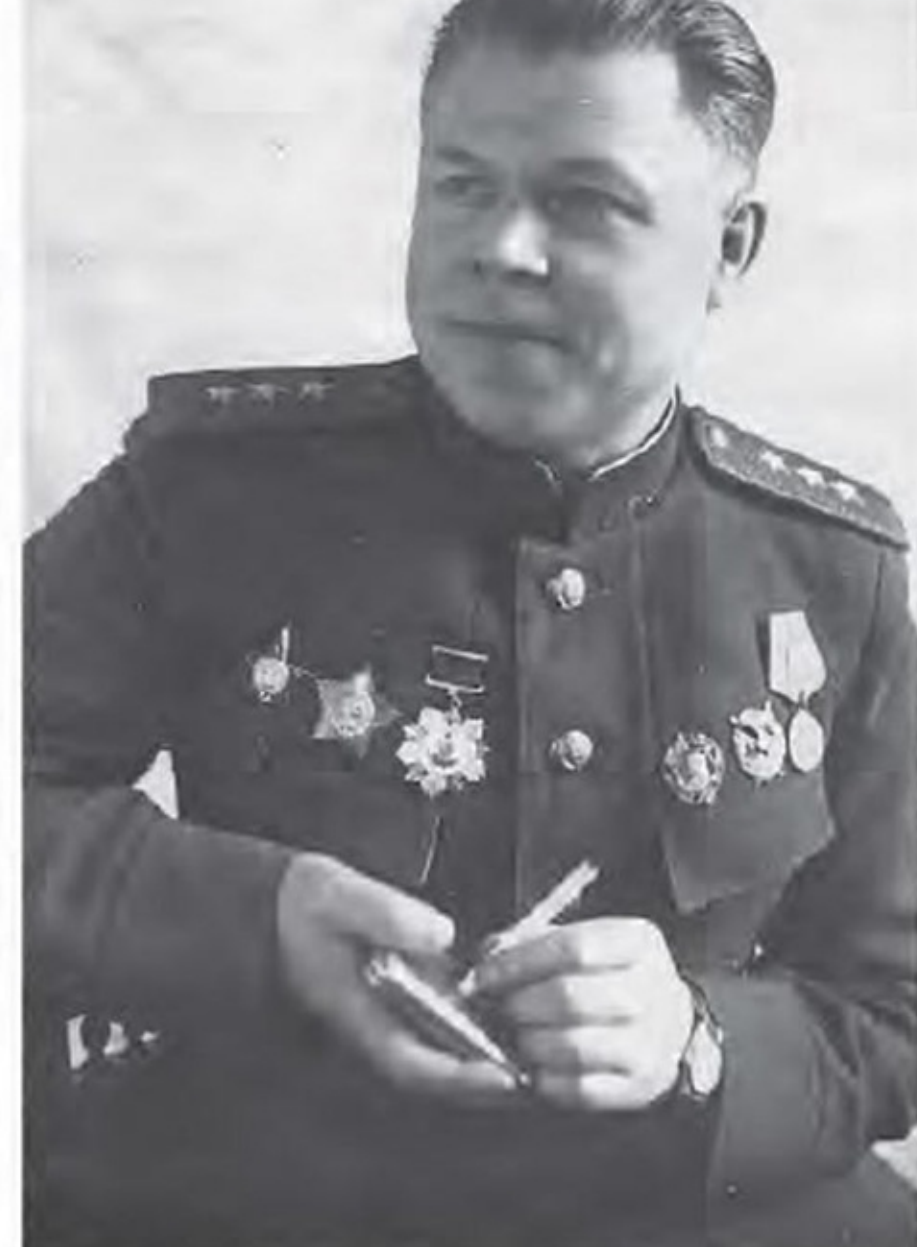
Начальник штаба 1-го Белорусского фронта генерал-полковник М.С. Малинин. Гомель. 1944 г. ▶