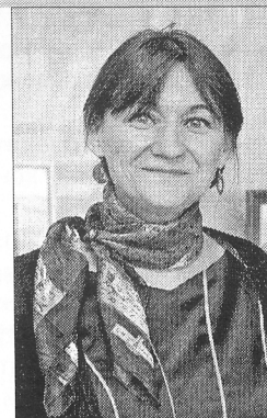
Загадчык сектара Нацыянальнай бібліятэкі Беларусі