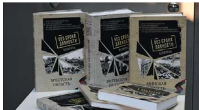
Выданні, прысвечаныя нацысцкім злачынствам у Беларусі