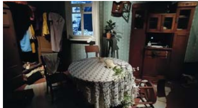
Мемарыяльны комплекс "Хатынь". Адна з зал