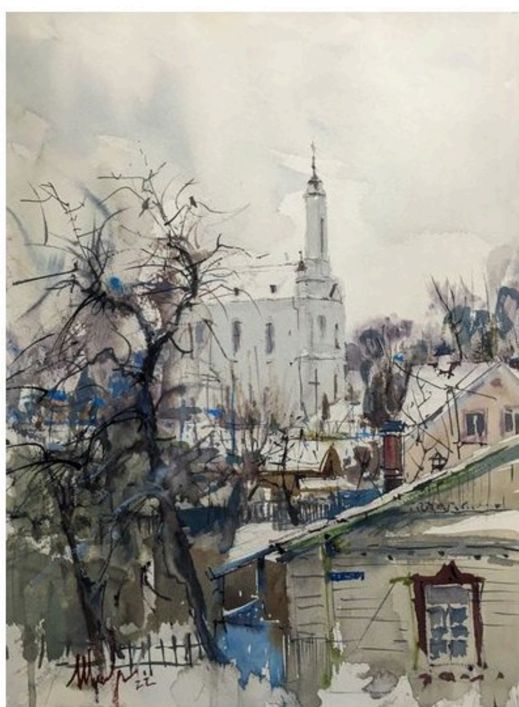
Владимир Шаповалов. "Тихий зимний вечер. Заславль", 2022 г.

НББ пятый раз принимает ежегодный фестиваль искусства «Арт-Минск». Он стал одним из самых значимых художественных мероприятий страны как для представителей профессионального сообщества, так и для многих жителей и гостей столицы. Масштабный праздник, как отмечают организаторы, подчинен единственной цели – подарить зрителю наслаждение от искусства.