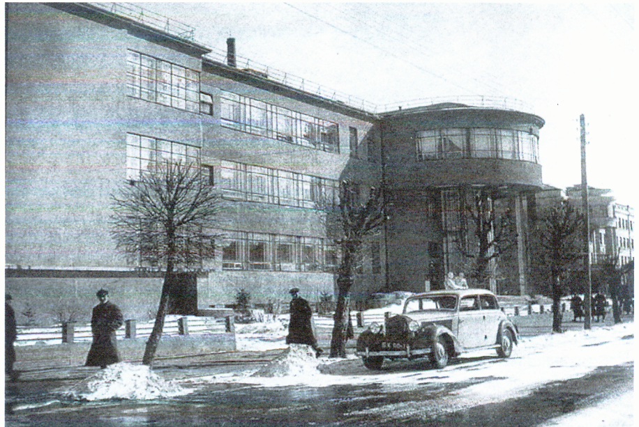
Здание Государственной библиотеки и Библиографического института БССР имени В.И. Ленина. 1930-е гг.

Предпринятый автором летом 2021 г. архивный поиск позволил к