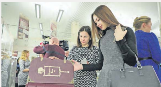
Еще одной красивой традицией книжной культуры Беларуси стал стартовавший в Национальной библиотеке проект «Книги Беларуси. Год 2019».

читатели познакомились с произведениями академика и писателя Вацлава Ластовского.