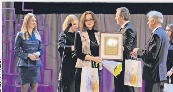
Очень приятно, что среди награжденных в номинации «За активную папулярнасьцяю кнігі і чытаньня ў 2019 годзе» — издательский дом «СБ. Беларусь сегодня».